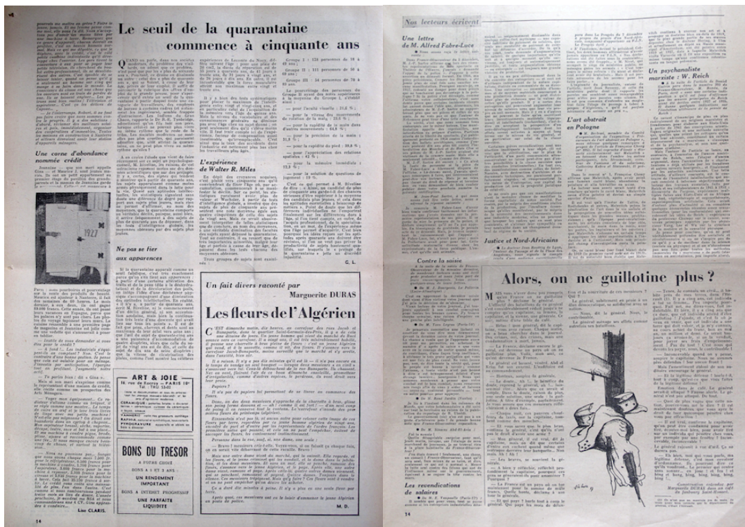
« Les Fleurs de l'Algérien », France-Observateur, 28 février 1957

du 17 octobre 1961 11 , Marguerite Duras publie « Les Deux ghettos » et met en parallèle l'entretien avec deux Algériens et la confiance d'une survivante du ghetto de Varsovie. La convocation de l'histoire, par la comparaison entre les Algériens et les Juifs, sert à éclairer l'actualité du moment présent, comme en témoigne ce propos indifférent et cruel de M. : « J'ai appris hier qu'il y avait beaucoup d'Algériens noyés dans la Seine. Il n'y a là-dedans rien d'étonnant pour moi 12 . »