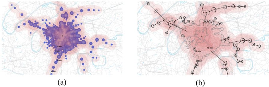
Figure 1: (a) exemple d'une carte isochrone d'accessibilité d'une zone urbaine en transports en commun: les zones atteignables de 10 à 25 min sont représentées grâce à un gradient de couleur. (b) carte isochrone simplifiée en utilisant des principes de généralisation cartographique lors de sessions de conception collaborative, afin de mettre en avant l'information essentielle telles que les zones homogènes en accessibilité (au centre) et les stations de métros (demi-cercles) le long du trajet des métros ou trains.

LIRIS, visionscarto.net École Centrale de Lyon, Université Lyon 1