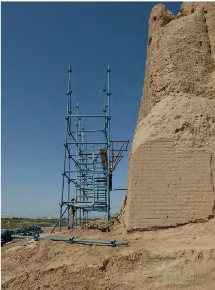
Fig. 7 – Échafaudage implanté sur la façade extérieure sud du Grand Kyz Kala, vue de l'est (CRAterre, Ch. Sadozai, 2015).

– Nous avons commencé par l'installation d'un échafaudage sur toute la longueur de la face externe du mur. Le bâtiment ayant un fruit à sa base, il s'est vite révélé inutile de monter trop haut, le décalage étant de plus de 1 m de profondeur à 3 m de haut ( fig. 7 ).