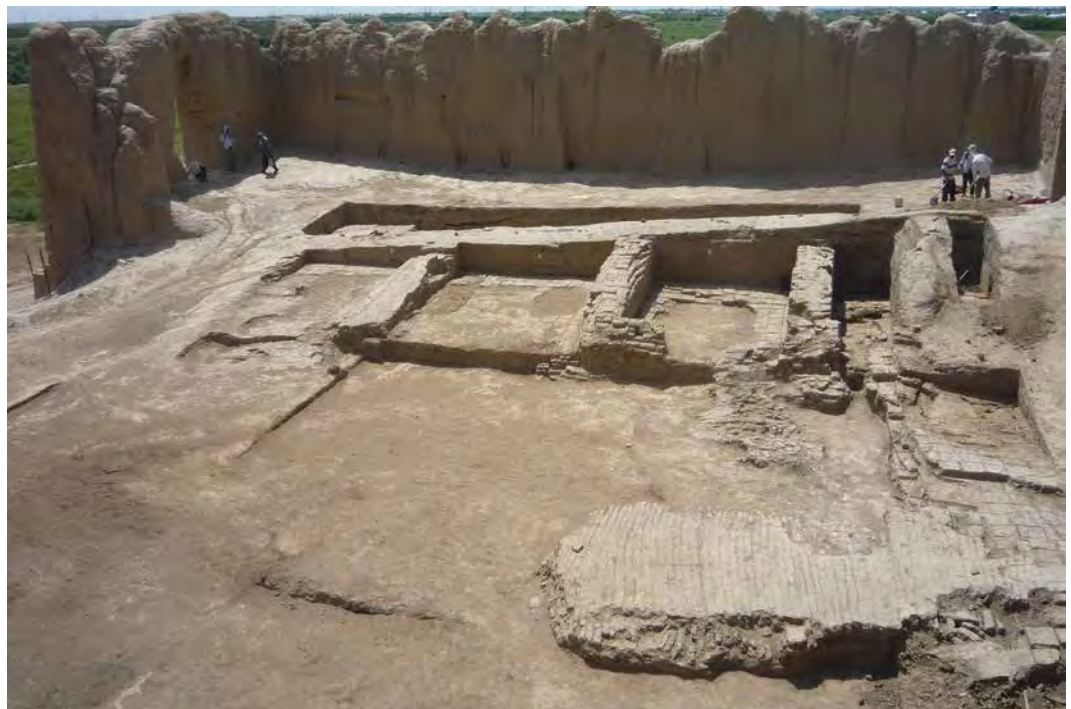
Fig. 6 – Intérieur du Grand Kyz Kala en cours de fouilles, vue du nord (Parc historique et culturel de l'Ancienne Merv, Dzaparov, 2013).