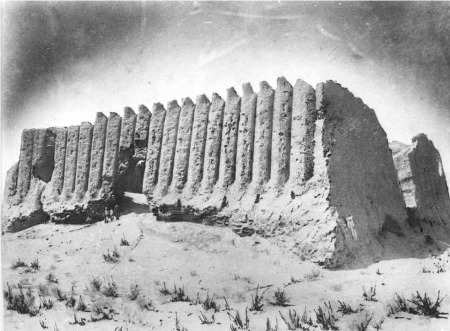
Fig. 3 – Le Grand Kyz Kala, vue de l'est (Zhukovsky, 1890).