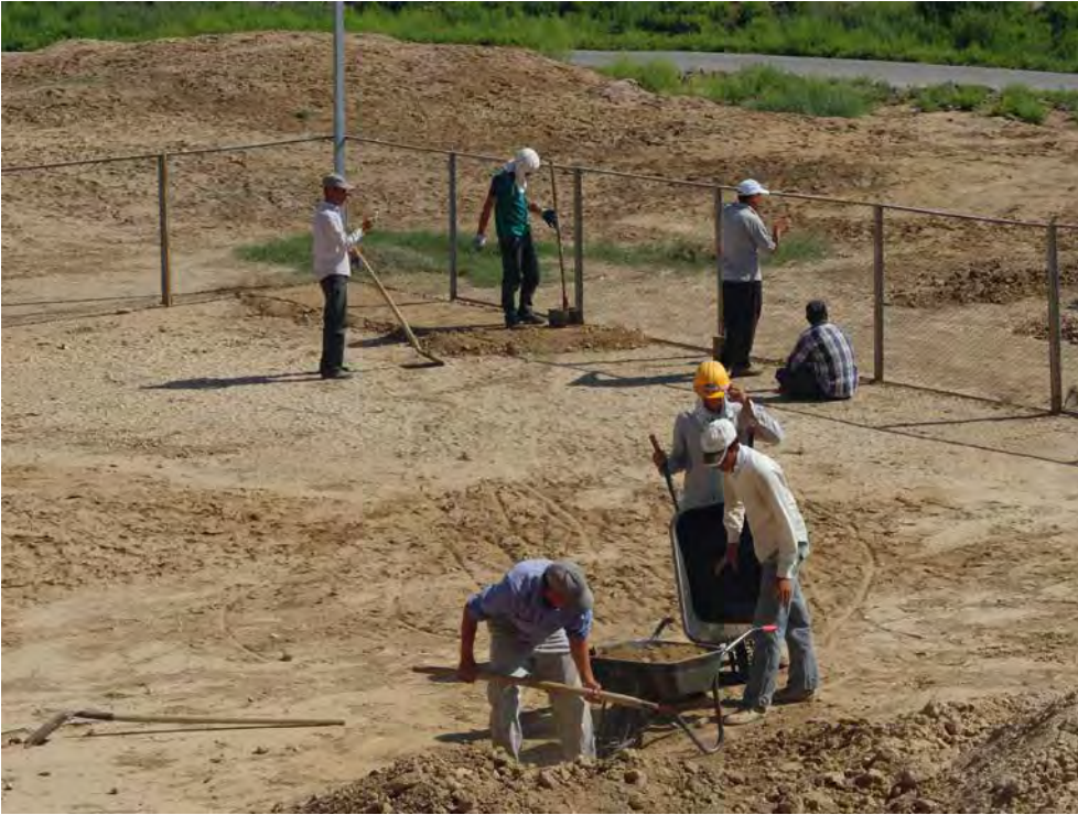
Fig. 13 – Damage de plusieurs lits de terre pour un meilleur drainage, coin nord-est à l'extérieur du Grand Kyz Kala.

Dans l'attente de trouver des outils plus adaptés à la hauteur du mur et garantissant une sécurité satisfaisante, les travaux que nous avons engagés se sont arrêtés à ce stade. Une équipe de douze ouvriers, dont plusieurs maçons spécialisés dans la conservation des vestiges de l'Ancienne Merv, ont été sensibilisés à cette nouvelle approche, spécifique au Grand Kyz Kala du fait de son exceptionnel état de conservation et des problématiques d'ensemble qu'il suppose.