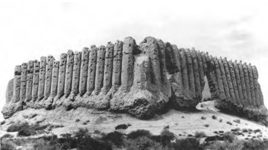
Fig. 4 – Le Grand Kyz Kala, vue du sud-est (Pilyavsky, 1971).

du bâtiment durant les campagnes 2012 et 2013 15 ont provoqué des zones de stagnation des eaux de pluie. En effet, des carrés correspondant à des pièces ont été ouverts et vidés sur une profondeur importante, sans possibilité d'écoulement ( fig. 6 ).