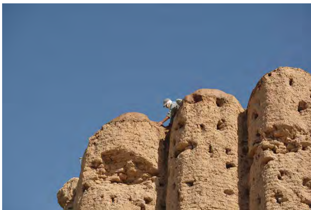
Fig. 12 – Pose de couches d'enduit sacrificiel en tête de mur, façade sud du Grand Kyz Kala, vue du sud (CRATERre, Ch. Sadozai, 2015).

– Enfin, suite au relevé de circulation des eaux de ruissellement ( fig. 6 ), quelques opérations de drainage ont été effectuées afin de minimiser les pathologies. La grande cuvette d'eau stagnante observée durant l'hiver, au nord-est de l'enclos dans lequel est ceint le monument, a été comblée par des lits de terre damée afin de mieux absorber l'eau et d'éviter un profil en cuvette ( fig. 13 ).