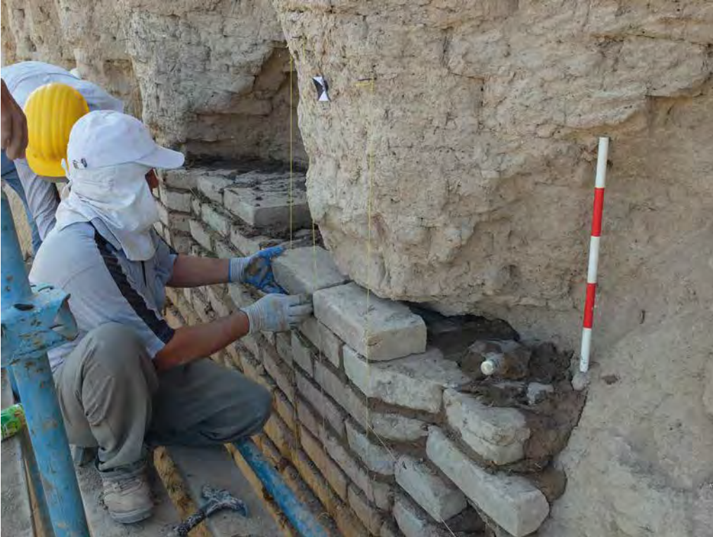
Fig. 9 – Détail de la restitution choisie pour la base de colonne, en cours de conservation. Grand Kyz kala, façade sud (CRATERre, Ch. Sadozai, 2015).