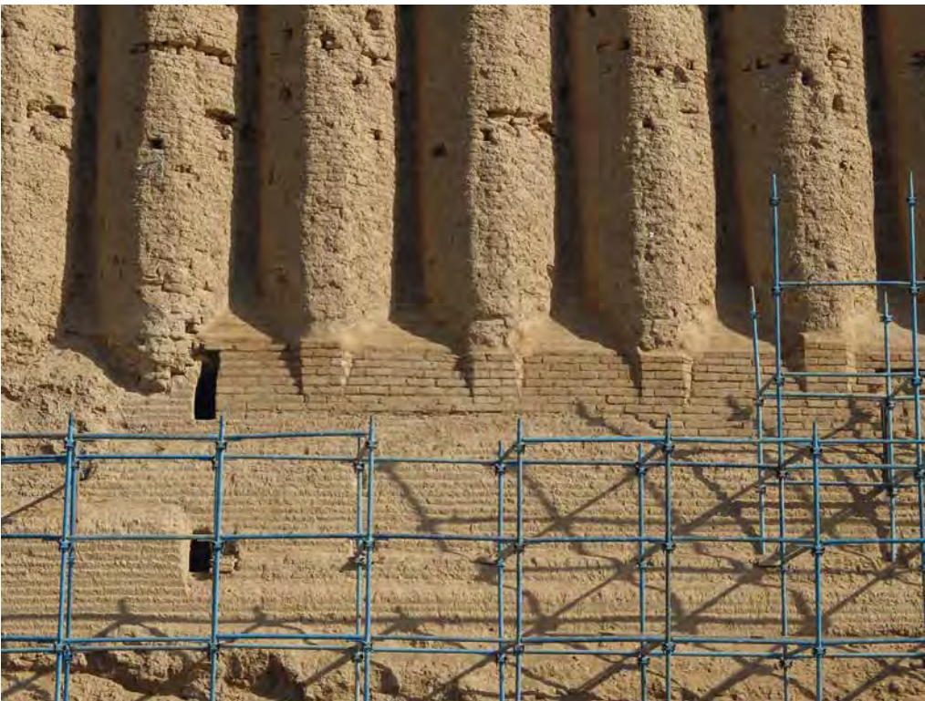
Fig. 10 – Vue rapprochée des bases de colonnes conservées sur la façade sud du Grand Kyz Kala (CRATERre, Ch. Sadozai, 2015).