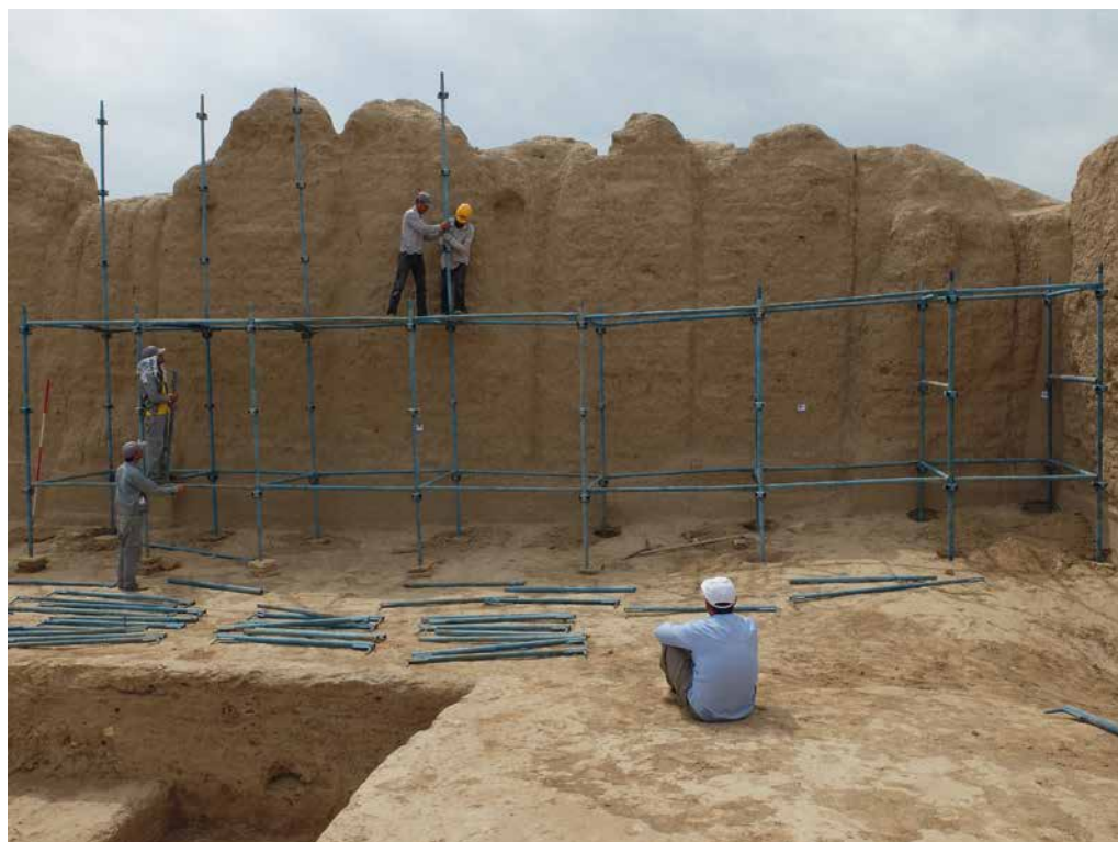
Fig. 11 – Montage de l'échafaudage sur la façade interne sud du Grand Kyz Kala.