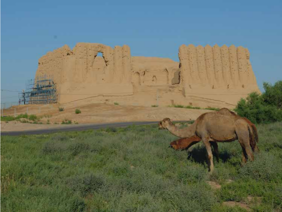
Fig. 2 – Le Grand Kyz Kala, vue de l'est.

Le Grand Kyz Kala est l'un de ces bâtiments ( fig. 2 ).