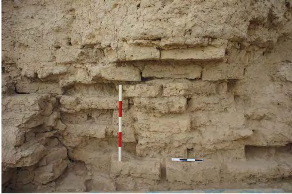
Fig. 8 – Détail de la maçonnerie d'origine à la base d'une semi-colonne engagée, façade sud du Grand Kyz Kala.

– Plusieurs propositions de restitution ont été évoquées suite à ces observations. Architecte, conservateur, archéologue et maçon se sont mis d'accord sur une forme légèrement biseautée à la base, où les briques de la colonne reprennent le calepinage des briques de la masse du mur ( fig. 9 ). Elles sont peu saillantes à la base de la colonne et s'alignent avec l'extérieur de celle-ci dans sa partie la plus large. Entre les colonnes, le système d'encorbellement a été repris plus significativement, rentrant et non plus saillant. La forme en triangle de cet espace, et sa position à l'embouchure de la saignée provoquée par l'alternance de deux colonnes suppose, comme un cône de déjection à l'embouchure d'une rivière, que de la matière sacrificielle sous forme visqueuse, voire liquide, venait s'y répandre 18 ( fig. 10 ).