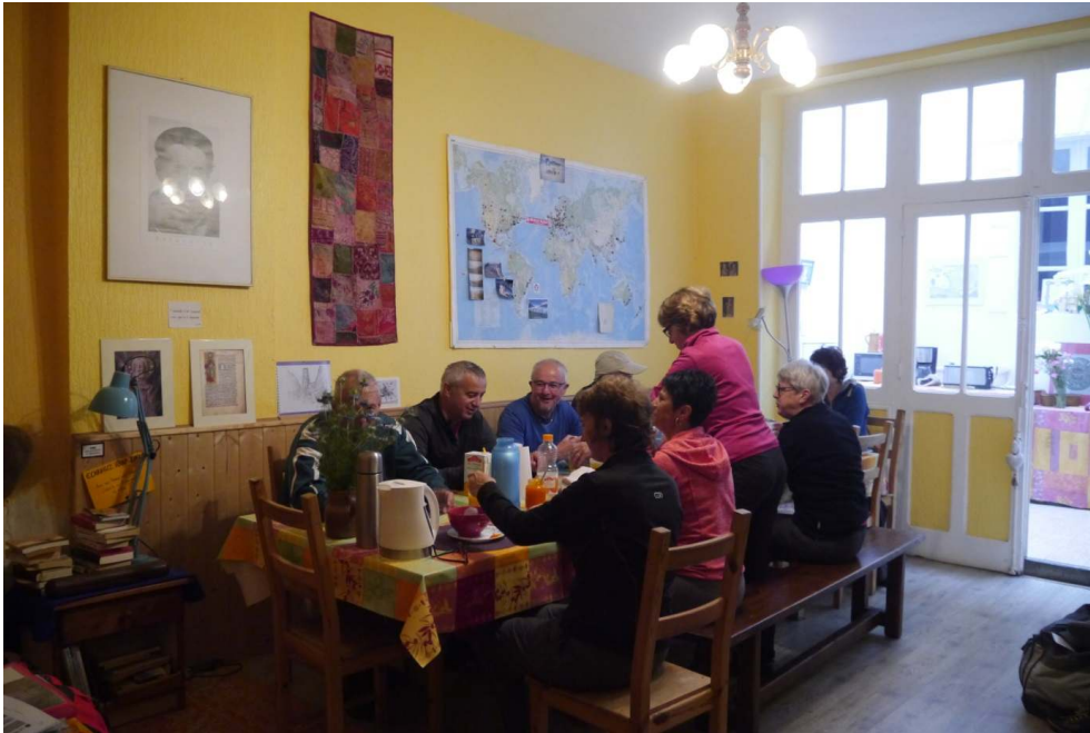
Figure 5. Moment de convivialité dans un gîte de Lecture (Gers).