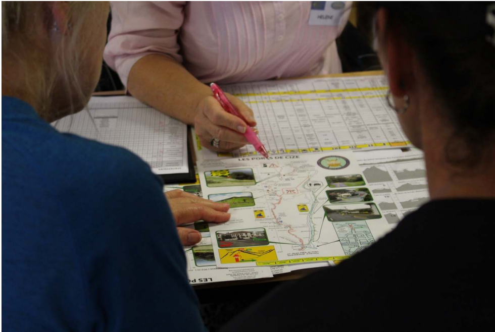
Figure 2. A Saint-Jean-Pied-de-Port, le bureau des pèlerins réunit près de 200 bénévoles qui se relaient pour distiller des conseils aux marcheurs qui s'apprêtent à quitter la France pour continuer leur route vers Compostelle, sur le « Camino Francés ».