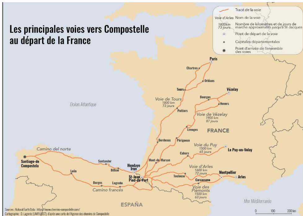
Figure 1. Carte des principales voies vers Compostelle au départ de la France.