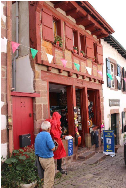
Figure 4a. Magasin spécialisé dans la vente d'articles de randonnées à destination des marcheurs en route vers Compostelle (Saint-Jean-Pied-de-Port, Pyrénées-Atlantiques).