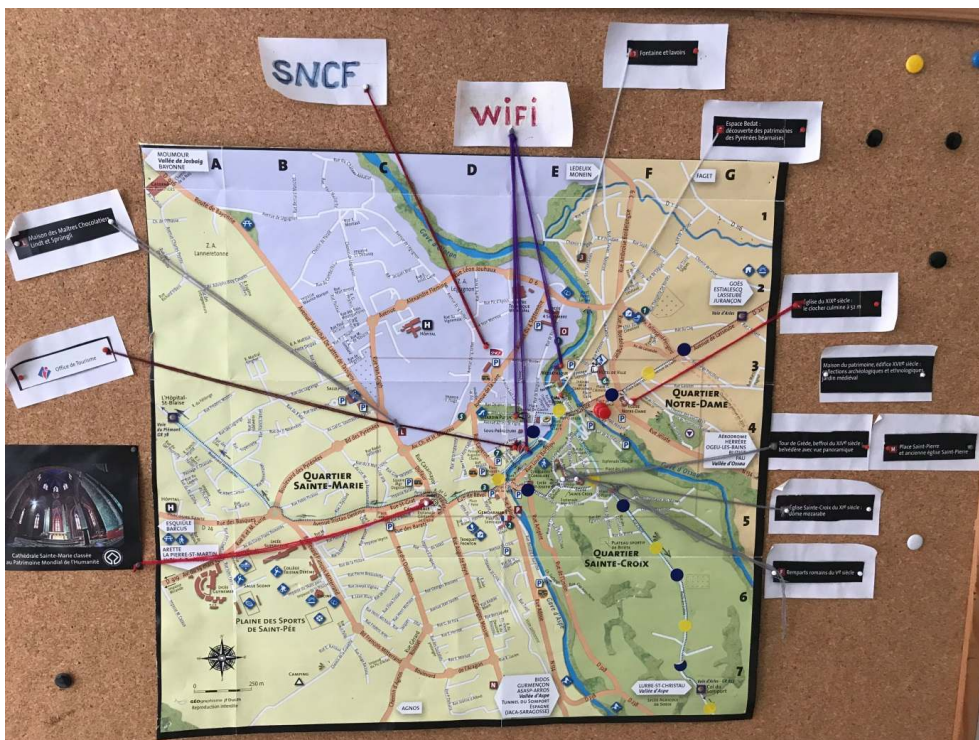
Figure 4b. Carte « bricolée » dans un gîte localisant les sites touristiques et services disponibles pour les pèlerins-cheminants (Oloron Sainte-Marie, Pyrénées-Atlantiques).