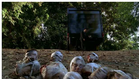
Figure 6 Fringe

Les métamorphes n'ont alors pas d'individualité par eux-mêmes parce que leur identité changeante est au service d'un pouvoir centralisé qui donne un sens unique à leur existence. Fringe postule l'existence d'un monde parallèle en conflit avec le monde original poussant alors les scientifiques du monde parallèle à créer les métamorphes. L'agencement du pouvoir propre au monde parallèle repose donc sur une production effrénée de nouveaux visages. Dans Mille Plateaux (1980), Gilles Deleuze et Félix Guattari nomment « plan d'organisation » une unité transcendante qui concerne le développement des formes et la formation des sujets 13 . La subjectivation devient, dans ce cadre, l'enjeu d'un agencement autoritaire 14 . Fringe expose le plus littéralement possible un agencement autoritaire transcendant puisque c'est un autre monde qui est responsable de l'existence des métamorphes. La formation de nouveaux visages est la manifestation la plus exemplaire de ce plan d'organisation puisque toujours selon Deleuze :