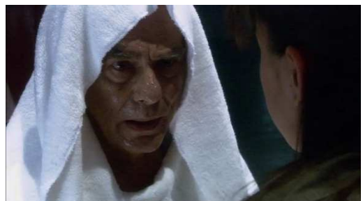
Figure 17 Battlestar Galactica

de condensation de caractéristiques éparses accumulées au cours de la série. La résurrection permet donc de singulariser deux personnages autour des final five malgré le principe de dissemblance de la synchronie actoriale.