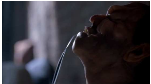
Figure 2 Fringe