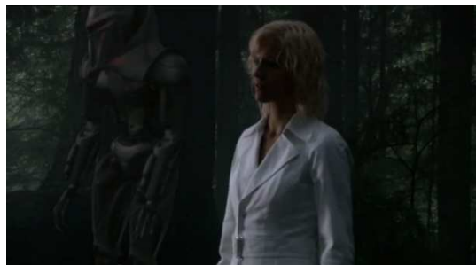
Figure 12 Battlestar Galactica