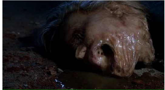
Figure 7 Fringe

Cette dépendance à un principe transcendant concernant l'attribution d'une identité conduit à un avilissement généralisé des victimes. En effet, la saison 4 réactualise le motif de la victime décapitée anonyme. Les protagonistes découvrent dans un sous-sol des dizaines de victimes aux corps décomposés. Un plan plus précis montre en gros plan une tête sans visage, séparée de son corps, donc « dé-visagéifié » à l'extrême (le visage est difforme et presque « lisse ») faisant de ce lieu