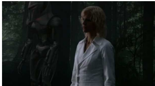
Figure 12 Battlestar Galactica