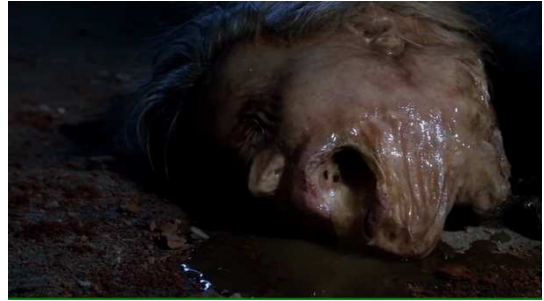
Figure 7 Fringe

Cette dépendance à un principe transcendant concernant l'attribution d'une identité conduit à un avilissement généralisé des victimes. En effet, la saison 4 réactualise le motif de la victime décapitée anonyme. Les protagonistes découvrent dans un sous-sol des dizaines de victimes aux corps décomposés. Un plan plus précis montre en gros plan une tête sans visage, séparée de son corps, donc « dé-visagéifié » à l'extrême (le visage est difforme et presque « lisse ») faisant de ce lieu