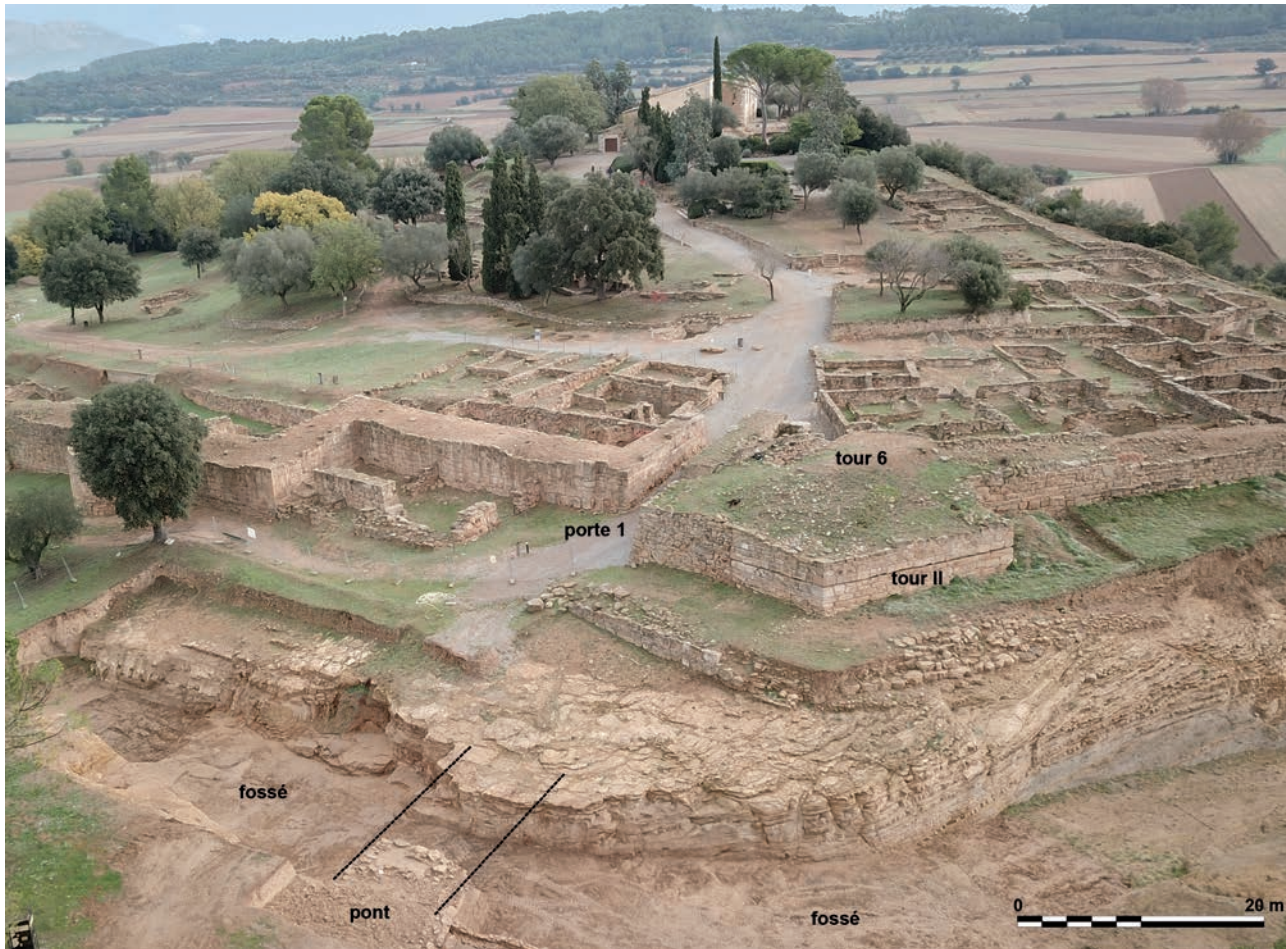
Fig. 3. Vue aérienne des structures défensives concentrées dans l'angle SO de la colline.

diverses caractéristiques selon l'époque de sa construction. On peut ainsi distinguer deux grandes phases qui, apparemment, seraient directement liées à la construction de la première enceinte, durant la seconde moitié du VI e siècle av. n. è., puis à sa réfection et son agrandissement, vers la fin du V e siècle ou le début du IV e siècle av. n. è. (Martin 2000, p. 110).