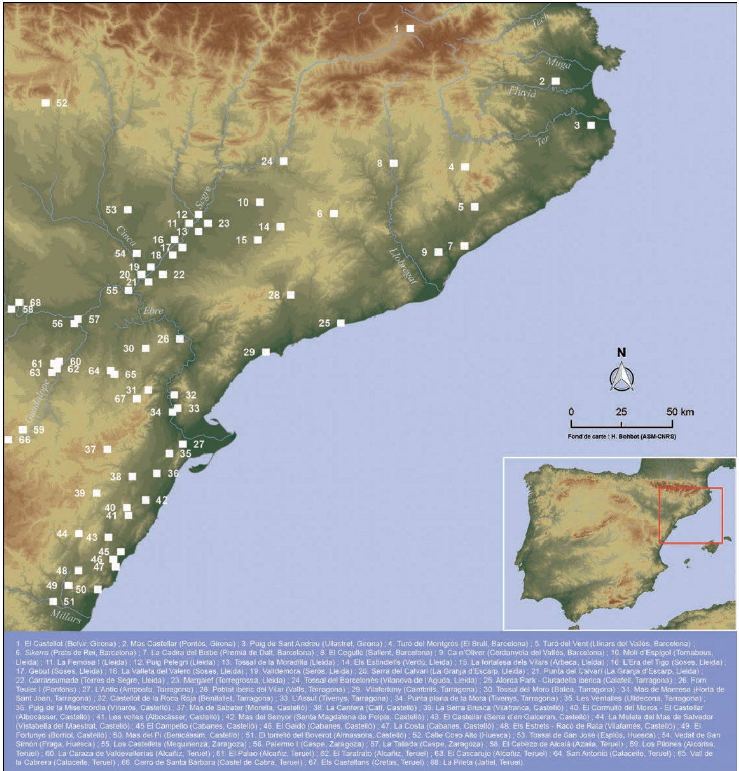
Fig. 1. Carte de distribution des fossés de l'âge du Fer au nord-est de la péninsule Ibérique.