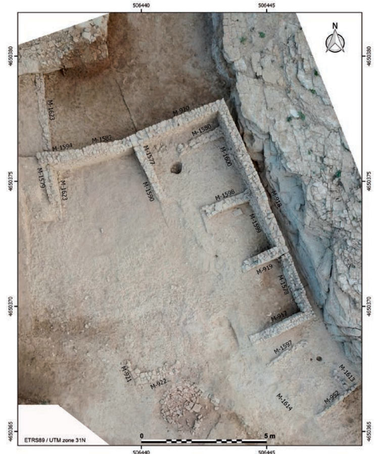
Fig. 5. Orthophotographie d'une partie du quartier périurbain construit partiellement à l'intérieur du fossé (cl. MAC).

Le pourcentage de mise à profit de la carrière pour construire les parements externes de la muraille est très variable et oscille selon l'emplacement du fossé d'où proviennent les blocs : cela va de 90 % par endroit, à pratiquement rien ailleurs. Néanmoins, une première analyse du tronçon de fossé mis au jour jusqu'ici montre que le pourcentage moyen de mise à profit est légèrement supérieur à 50 %. Le reste, c'est-à-dire aussi bien le rebut des opérations d'extraction que le matériau qui, de par ses caractéristiques géo-mécaniques, devait se fragmenter, pouvait être employé pour le remplage de la muraille, dans une proportion de 2/3 de pierre pour 1/3 de terre, ou pour d'autres constructions, notamment les fondations des habitations.