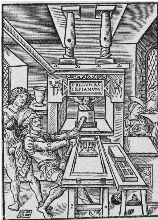
Fig. 2. Troisième marque de Josse Bade (1529) d'après Ph. Renouard, Les Marques typographiques parisiennes, 1926, n° 24 (numérisation : CESR/BVH ; BaTyR n° 27501)