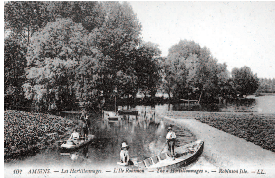
Fig. 4 : La transmission du réseau de rieux par la généralisation du canotage

Extraction and cutting of peat into bricks which was then transported for drying Amiens, Marais de Rivery-lez-Amiens, 1900-1913, AD Somme, DA677