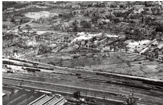
Fig. 5 : La ville industrielle à la conquête du Sud des Hortillonages

The generalisation of boating on the water network Amiens, Les Hortillonages, Robinson Island, 1900-1913, AD Somme, 8Fi324