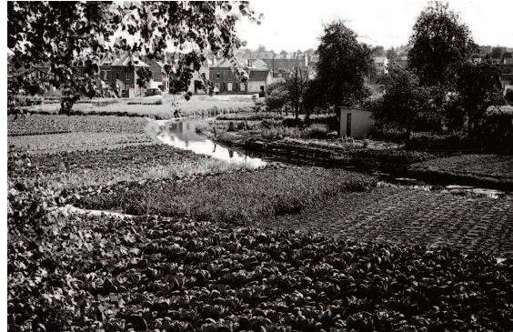
Fig. 2 : La Neuville, un quartier d'Amiens ouvert sur les cultures maraîchères

The new situation that has affected the Hortillonages for the last 30 years refers to many domains. The underlying systems of representation reveal the morphological and dynamic complexities of the site and their anchoring in time. The reconstruction of the Hortillonages landscape highlights several socio-economic relationships maintained with the marshland, according to their chronology, and subtle or even unique combinations of heritage from one area to another. This reconstitution work also underlines the operating system specific to each era, with elements external to the site that weigh on its history. Thus, if it is difficult to define the Hortillonages, it is because they are closely linked to the city, and vice versa. The challenge is to integrate all of the interlocking legacies into territorial action to consider the Hortillonages in their entirety and their plurality.