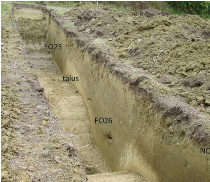
Fig. 4. Fossés 31 chemin de la Croux del Fiou.

Ces derniers se signalent également par un comblement rapide, effectué à date haute c'est-à-dire à la fin du II e ou durant la première moitié du I er siècle av. n. ère. Ils devaient être associés à des talus qui n'ont pas laissé de traces mais il est possible que le comblement des fossés provienne de la destruction de ces derniers. Le mobilier céramique est peu volumineux et très fragmentaire. Ces fossés ne servaient donc pas de dépotoirs domestiques et ont été régulièrement entretenus. Mis en perspective avec les données du lidar, ces découvertes archéologiques amènent à s'interroger sur la nature du système défensif dans son ensemble. Il semble que plusieurs lignes de défense existent dans le flanc du coteau de Ventenac .