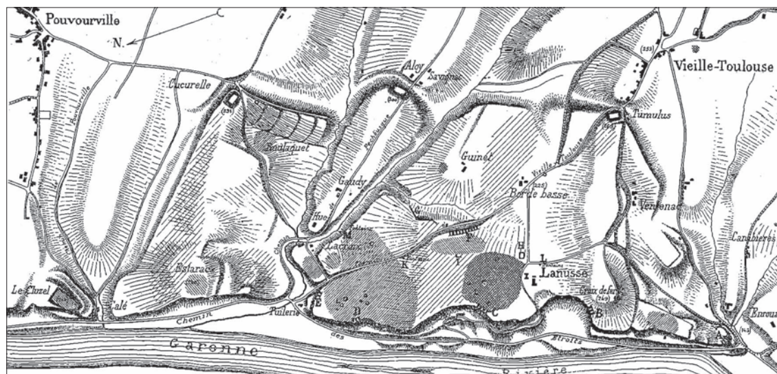
Fig. 1. Plan de Vieille-Toulouse d'après Joulin 1901.

La fin des années 1960 coïncide avec la remise en cause de ce modèle par M. Labrousse. De son point de vue, les buttes citées par Joulin sont d'époque médiévale et les différents talus