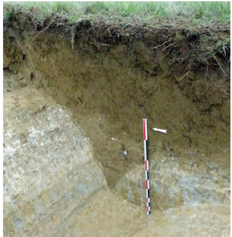
Fig. 5. Fossé 4 chemin de Ventenac.

Ces derniers se signalent également par un comblement rapide, effectué à date haute c'est-à-dire à la fin du II e ou durant la première moitié du I er siècle av. n. ère. Ils devaient être associés à des talus qui n'ont pas laissé de traces mais il est possible que le comblement des fossés provienne de la destruction de ces derniers. Le mobilier céramique est peu volumineux et très fragmentaire. Ces fossés ne servaient donc pas de dépotoirs domestiques et ont été régulièrement entretenus. Mis en perspective avec les données du lidar, ces découvertes archéologiques amènent à s'interroger sur la nature du système défensif dans son ensemble. Il semble que plusieurs lignes de défense existent dans le flanc du coteau de Ventenac .