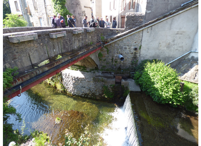
Fig. 1. Ouvrages hydrauliques à Génolhac, point de départ d'une matinée sur le terrain avec les responsables des associations d'utilisateurs.

Le canevas avait aussi pour fonction de délimiter l'espace du dialogue. Partant du fait que la question du devenir des canaux communautaires se pose au Nord comme au Sud, trois thèmes de réflexion ont été proposés au groupe. Le premier, « réinvention des canaux d'irrigation communautaire », invitait à interroger les