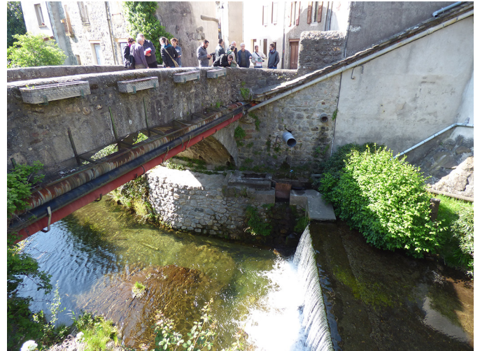
Fig. 1. Ouvrages hydrauliques à Génolhac, point de départ d'une matinée sur le terrain avec les responsables des associations d'utilisateurs.

Le canevas avait aussi pour fonction de délimiter l'espace du dialogue. Partant du fait que la question du devenir des canaux communautaires se pose au Nord comme au Sud, trois thèmes de réflexion ont été proposés au groupe. Le premier, « réinvention des canaux d'irrigation communautaire », invitait à interroger les