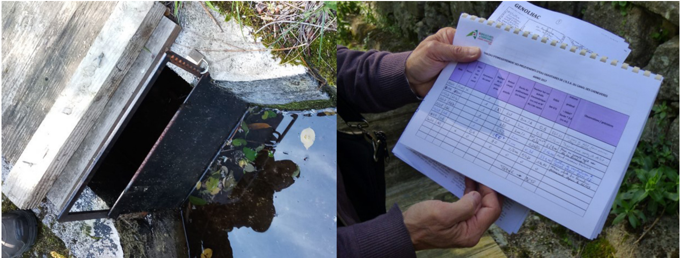
Fig. 2. À gauche, martelière équipée d'une échelle crantée. Son installation découle des mesures de suivi adoptées par l'administration. La position de la vanne permet de réguler le prélèvement. À droite, chaque association d'irrigants doit renseigner les changements de position de la martelière.