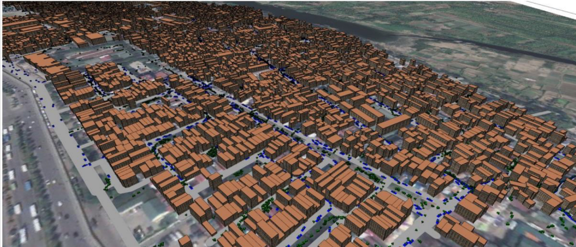
Figure 3: Illustration de la simulation de l'évacuation du quartier de Phuc Xa, Ha Noi.