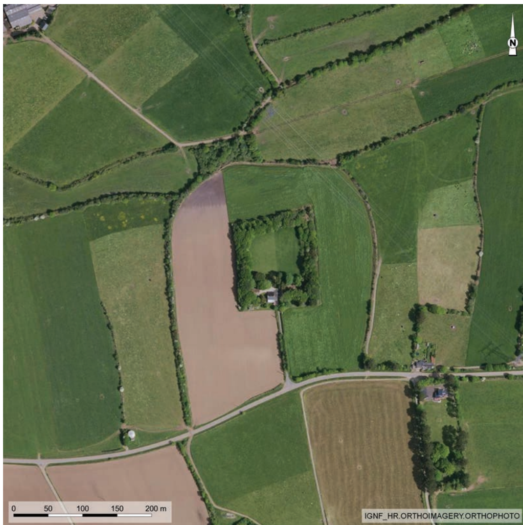
Fig. 6. Pont-de-Buis-Lès-Quimerc'h (Finistère), Le Muriou . Anomalie topographique particulièrement visible au milieu du paysage bocager. L'enceinte quadrangulaire, d'une superficie de 1,45 ha, a un talus conservé de 2 m d'élévation et un fossé large de 6 m. L'enclos ovalaire quienserme le site pourrait correspondre à une phase ancienne d'occupation, peut-être antérieure ou contemporaine à la fortification, d'après P. Maguer.

En règle générale, comme ailleurs dans le monde celtique, ces sites aux caractères spécifiques occupent de manière privilégiée des points de contrôle routier, le voisinage des gués, la proximité d'un gîte minéral exploité ou bien encore le noyau d'une agglomération. Ils dominent aussi de vastes espaces bien délimités par le réseau hydrographique local, comme La Grande Hélandais à La Dominelais (Ille-et-Vilaine). Les fouilles de Paule et de Trégueux (Côtes-d'Armor) ont permis une relecture d'enceintes terroyées conservées en élévation présentant des caractéristiques identiques. Les sites de Kerfloc'h en Plaudren (Morbihan), Le Muriou en Pont-de-Buis-Lès-Quimerc'h (Finistère) (fig. 6) appartiennent à cette catégorie. Tous ces sites peuvent être des résidences aristocratiques laténiennes dont l'attribution chronologique est souvent confirmée par la présence de céramiques d'importation ou d'amphores vinaires datées du I er siècle av. n. è.