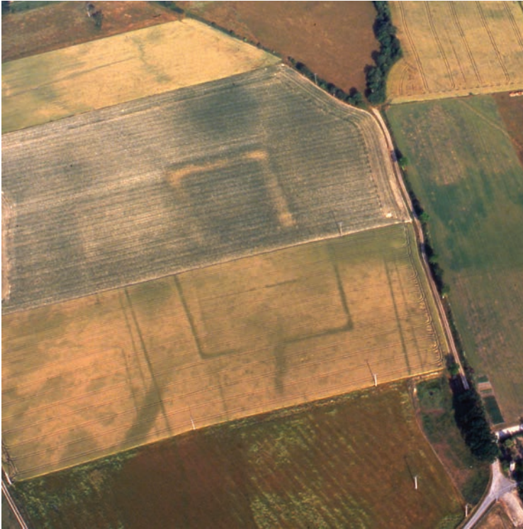
Fig. 3. Laigné (Mayenne), Vaugasnier , Établissement majeur de la fin de l'âge du Fer organisé à partir d'une enceinte rectangulaire fortifiée par un rempart de terre, elle-même précédée d'une vaste cour sur son côté occidental (cliché G. Leroux, Inrap, 19 juin 2006).