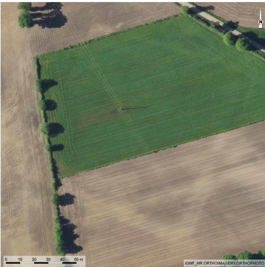
Fig. 5. Helléan (Morbihan), La Ville Collin . Enceinte arasée d'1 hectare et demi de superficie. Les tracés blanchâtres soulignent l'emplacement du talus-rempart doublé d'un large fossé (IGN Orthophoto 20 cm).