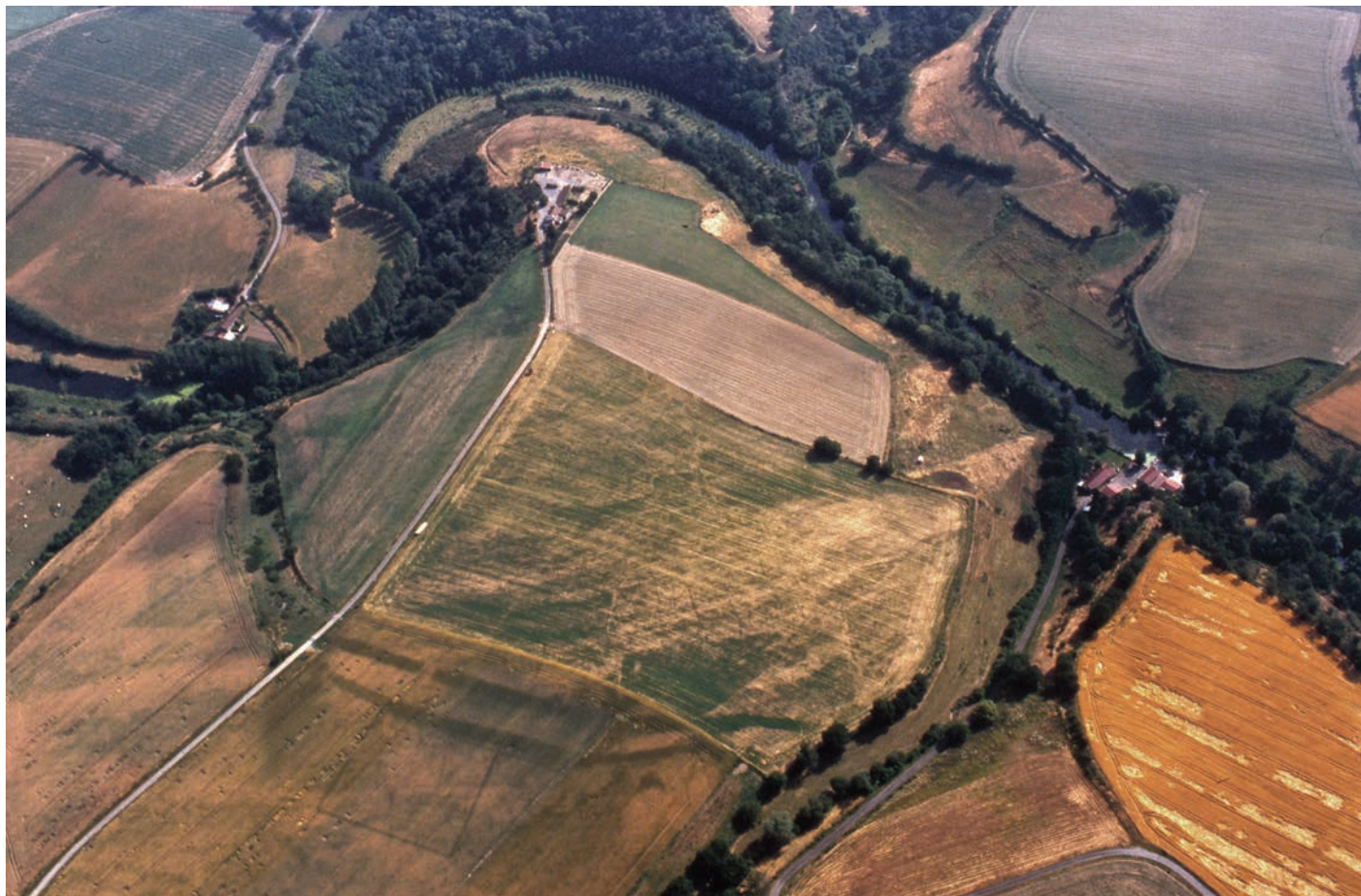
Fig. 2. Montrevault-en-Mauges (Maine-et-Loire), Le Chillou Neuf . L'éperon ciselé par les méandres de la vallée de l'Èvre sert de point d'appui à un dispositif de défense constitué d'une double ligne de fossés de plus de 8 m de large chacun et protégeant une surface de 15 ha (cliché G. Leroux, Inrap, 18 juin 2006).