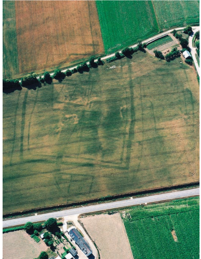
Fig. 4. Ménéac (Morbihan), Couesmélán . Vaste établissement quadrangulaire ceinturé par 3 fossés concentriques (250 x 160 m). On reconnaît l'espace résidentiel et les cours attenantes aux nombreux remaniements. Un petit enclos funéraire est visible à l'est, à proximité de l'entrée (cliché M. Gautier, 5 juillet 1995).