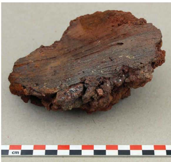
Fig. 2. Empreinte ligneuse de bois équarri sur un fragment de torchis vitrifié.