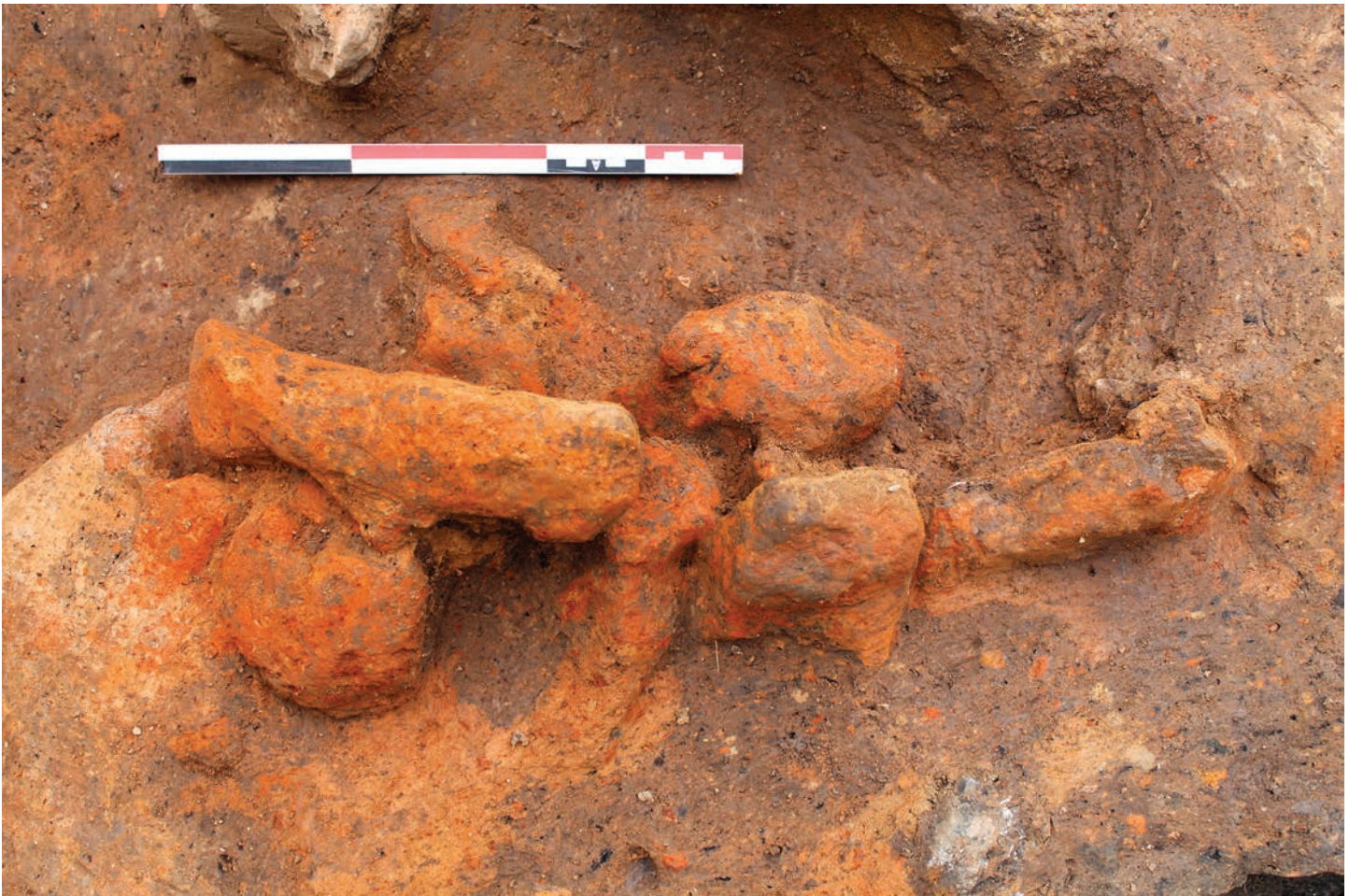
Fig. 6. « Mottes » de terre crue rubéfiées mises en évidence au niveau de la façade arrière du rempart, dans la tranchée 4 (cl. J. Remy, 2015).

sur leur qualité technologique et sur celle du système constructif. Couplée à l'analyse stratigraphique, celle-ci permettra d'évaluer le niveau de connaissance dans la conception et la maîtrise d'œuvre du bois.