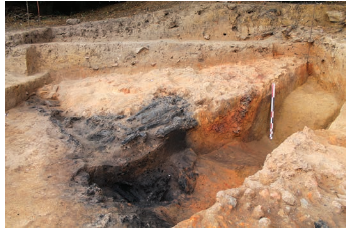
Fig. 5. Extrémité sud de la tranchée 4 : vue depuis le nord de la façade arrière du rempart matérialisée par la ligne de bois et la rampe en terre.