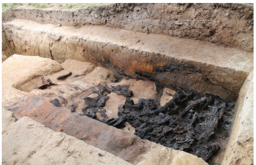
Fig. 3. Vue depuis l'ouest du sondage 2, en cours de fouille : la façade arrière en bois incendiée et effondrée au contact de la rampe limoneuse beige.