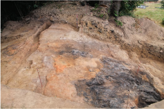
Fig. 4. Vue depuis l'est du sommet du rempart dans le sondage 1 : à droite, une structure en bois carbonisée, effondrée (cl. J. Remy, 2015).