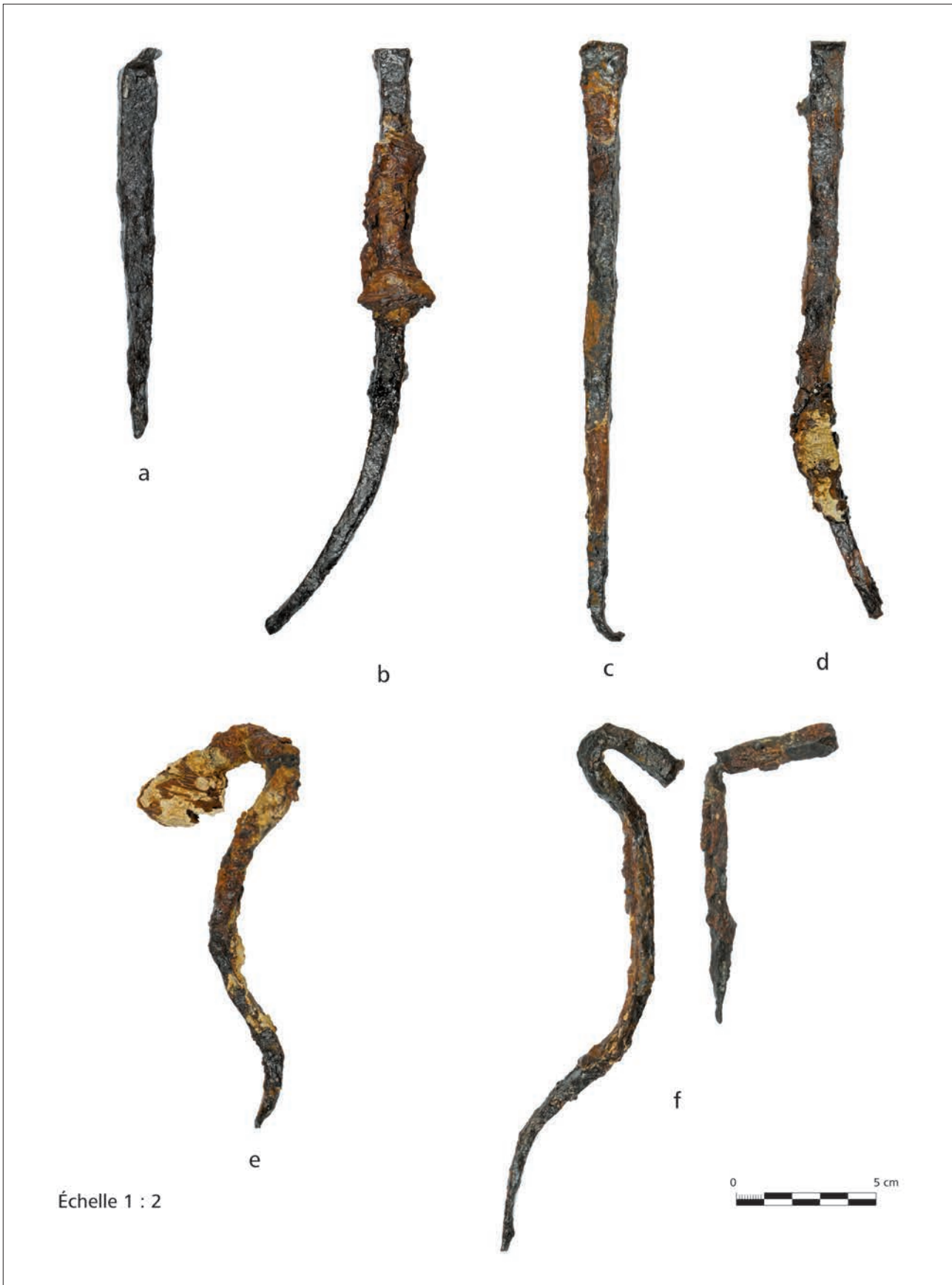
Fig. 2. Exemples de clous provenant du murus gallicus de Boviolles (Meuse) montrant les différents indices lisibles : a. Trace de découpe liée à la fabrication ; b. Fibres de bois perminéralisées ; c. Pliure de l'extrémité d'un clou ayant traversé le bois ; d. Fibres de bois permettant de restituer les sens d'assemblage ; e. Clou plié accidentellement dont la tête a été enfoncée dans le bois ; f. Comparaison entre des clous pliés lors de la mise en œuvre ou postérieurement (photographie CARA, Maxence Pieters).