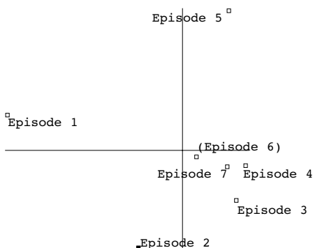
Schéma 2 : étude des discours de la séance

Deux analyses en composantes principales ont été réalisées, l'une avec tous les épisodes de la séance, l'autre avec seulement les épisodes d'exercices (c'est-à-dire sans l'épisode 2). Les plans factoriels considérés représentent respectivement 63 % et 68 %. Les épisodes 6 et 7 ne sont pas bien représentés dans ces deux plans factoriels 6 . Le professeur ne pose, pendant la séance, aucune question de structuration, ni de réflexion sur le lien avec le cours ou avec d'anciens chapitres (quand de telles questions sont présentes, elles correspondent en général à des demandes de démonstration).