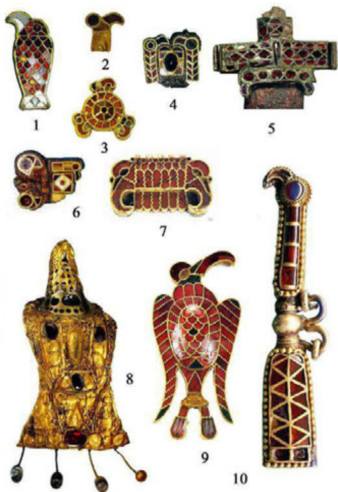
Рис. 3. Изображения птиц в инкрустационном декоре эпохи Великого переселения народов.

1 – Концешти; 2 – Сегед-Надьсекшош; 3, 7, 9 – Апахида, погребение 2; 4 – Керчь, склеп 163 1904 г.; 5 – Тамань, курганное погребение 1912 г.; 6 – Керчь, контекст находки неизвестен; 8 – Петросса; 10 – Былым-Кудинетово (1, 4–6 [по: Эпоха меровингов, 2007, кат. I.5.1, I.9.7.1, I..15, I.34.5]; 2 [по: Kürti, 1897, Taf. 5,Ш,3-47]; 3, 7, 9 [по: L'Or des princes barbares, 2000, Cat. N° 29,3,26,29]; 8 – фото Р. Хархою; 10 – фото А. В. Мастыковой).