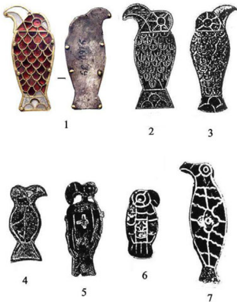
Рис. 1. Некоторые птицевидные украшения с декором в виде перегородчатой инкрустации. 1 – 3: Концешти (2: публиковалось как Керчь; 3: публиковалось как «Южная Россия»); 4: Лавиньи; 5: Мартере; 6: Чивидале; 7: Роммерсхейм (1 [по: Фурасьев, Шаблавина, 2019, илл. 100]; 2–7 [по: Казанский, 2014, рис. 12]).