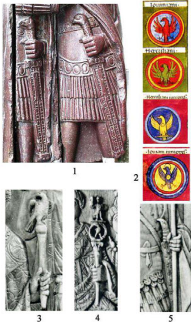
Рис. 4. Орел в позднеримской военной и властной символике.

1 – статуя тетрархов, Венеция (фото А. В. Мастыковой); 2 – изображения декора щитов в Notitia Dignitatum [по: L'Or des princes barbares, 2000, p. 22, 25, fol. 110, verso, fol. 74, verso]; 3 – консульский диптих Магнуса [по: Grabar, 1966, fig. 326]; 4 – консульский диптих Ареобинда [по: Grabar, 1966, fig. 320]; 5 – консульский диптих Проба Аниция [по: Grabar, 1966, fig. 329].