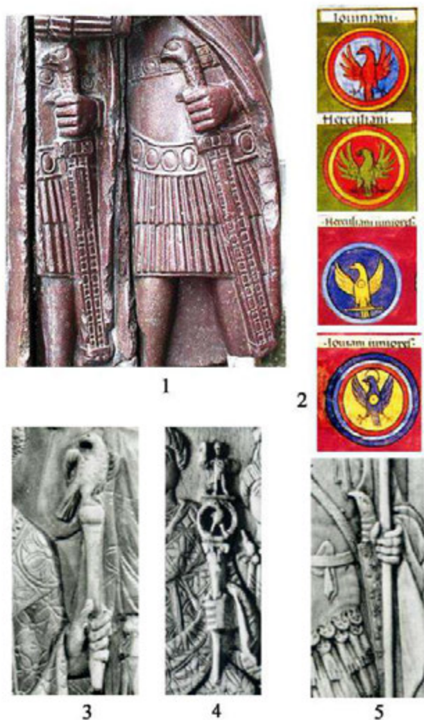
Рис. 4. Орел в позднеримской военной и властной символике.

1 – статуя тетрархов, Венеция; 2 – изображения декора щитов в Notitia Dignitatum [по: L'Or des princes barbares, 2000, p. 22, 25, fol. 110, verso, fol. 74, verso]; 3 – консульский диптих Магнуса [по: Grabar, 1966, fig. 326]; 4 – консульский диптих Ареобинда [по: Grabar, 1966, fig. 320]; 5 – консульский диптих Проба Аниция [по: Grabar, 1966, fig. 329].