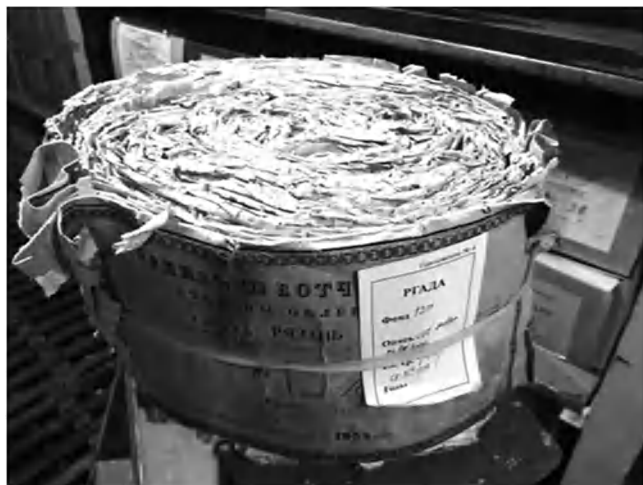
Figure 1 – Un rouleau du secrétariat des Domaines conservé dans son état d'origine