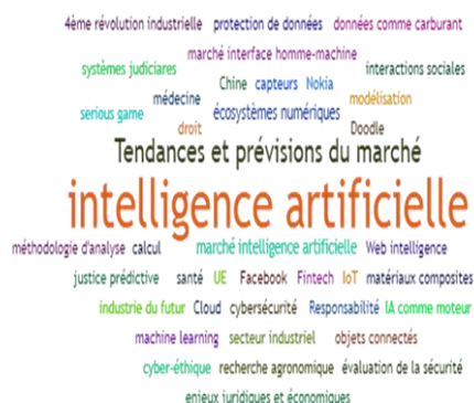
Figure 5. Visualisation des Tags en Intelligence Artificielle (powered by Sindup®)

La figure 5 montre les résultats de veille sur l'IA qui est considérée comme le cœur de la 4 ème révolution industrielle (de fait la poursuite de la 3 ème ). Elle provoque la constitution d'un large écosystème numérique intégrant des outils et des compétences permettant de détecter les tendances et prédire les marchés. C'est donc une révolution industrielle dont la finalité est similaire, sur le plan marketing, à l'utilisation classique des outils de veille stratégique. Outre l'aspect défensif de cette présentation marketing, elle dénote à nouveau une récursivité (cf partie 3) qui signifie qu'on arrive ici aussi à des concepts fondamentaux. 2 L'IE peut désormais utiliser ses propres outils pour se questionner.