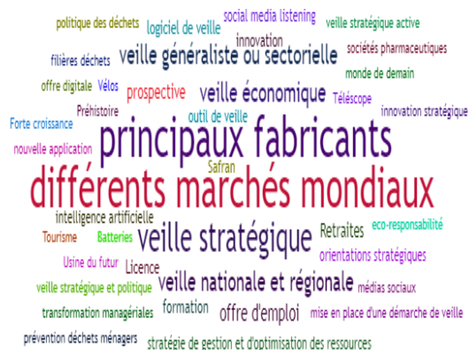
Figure 4. Visualisation des Tags en veille stratégique (powered by Sindup®)

Suite à l'utilisation de Sindup sur la veille stratégique (figure 4), nous avons remarqué une augmentation de la présence de rapports marchands entre les principaux fabricants en amont des différents marchés mondiaux et leurs clients, généralement des grands groupes industriels. Cela signifie une augmentation de la segmentation des marchés mondiaux, ce que la crise du Covid 19 a bien mis en évidence. Il ressort aussi que l'application des outils de veille doit avoir lieu à différentes échelles : nationale versus régionale ; généraliste versus sectorielle ; stratégique versus politique, etc.). Concrètement la veille fait appel à des logiciels et des plateformes qui présentent différentes fonctionnalités allant du sourcing à la diffusion des informations. Les veilleurs paramètrent ces plateformes en les connectant à des bases de données (professionnelles, scientifiques, brevets, ...), pour réaliser la veille concurrentielle et technologique et aux réseaux sociaux, pour réaliser la veille marketing et l'E-réputation (Fourati-Jamoussi, 2015 ; Fourati-Jamoussi et al., 2018).