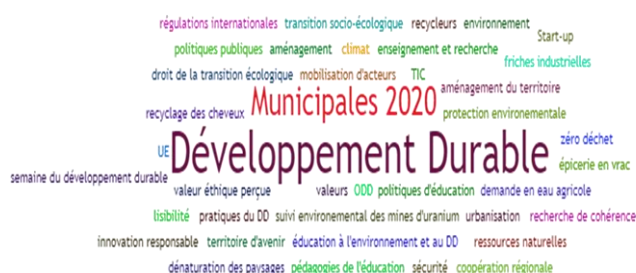
Figure 1. Visualisation des Tags en Développement durable (powered by Sindup®)

Une autre revue bibliométrique récente a analysé les publications sur les Objectifs du Développement Durable en utilisant des termes de recherche dans les titres, résumés et mots clés et en veillant dans Web of Sciences.