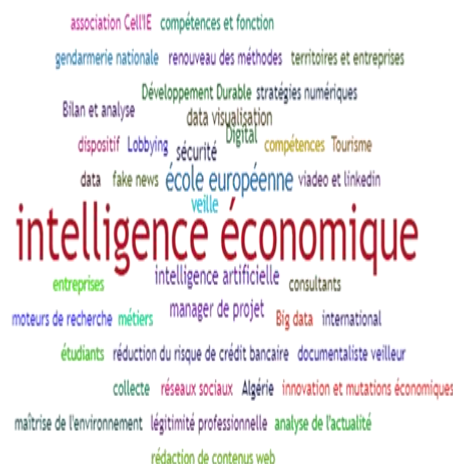
Figure 3. Visualisation des Tags en Intelligence Economique (powered by Sindup®)

Nous observons une évolution rapide de l'IE qui s'appuie sur les plateformes de veille stratégique au sein des pôles de compétitivité, des chambres d'agriculture, des coopératives, des différentes entreprises industrielles et même des sociétés de services. Les partenaires publics et privés abonnés ou adhérents de ces plateformes jouent le rôle de contributeurs et diffuseurs des informations touchant à leurs rôles et à leurs activités, institutionnelles ou économiques. La figure 3 montre que sur la base de la veille d'actualités, il existe des liens entre l'IE, le DD (sur les plans environnemental, économique et social) et l'IA (sur le plan technologique : moteurs de recherche, digital, Big Data et data visualisation , stratégies numériques, ...).