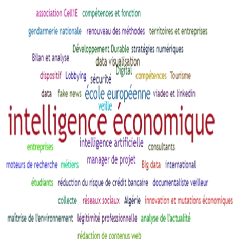
Figure 3. Visualisation des Tags en Intelligence Economique (powered by Sindup®)

Nous observons une évolution rapide de l'IE qui s'appuie sur les plateformes de veille stratégique au sein des pôles de compétitivité, des chambres d'agriculture, des coopératives, des différentes entreprises industrielles et même des sociétés de services. Les partenaires publics et privés abonnés ou adhérents de ces plateformes jouent le rôle de contributeurs et diffuseurs des informations touchant à leurs rôles et à leurs activités, institutionnelles ou économiques. La figure 3 montre que sur la base de la veille d'actualités, il existe des liens entre l'IE, le DD (sur les plans environnemental, économique et social) et l'IA (sur le plan technologique : moteurs de recherche, digital, Big Data et data visualisation , stratégies numériques, ...).