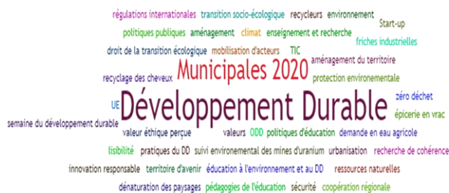
Figure 1. Visualisation des Tags en Développement durable (powered by Sindup®)

Une autre revue bibliométrique récente a analysé les publications sur les Objectifs du Développement Durable en utilisant des termes de recherche dans les titres, résumés et mots clés et en veillant dans Web of Sciences.