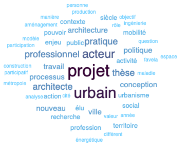
Figure 1 - Le projet, l'urbain et les acteurs au cœur des thèses

Plus que les disciplines académiques telles que la sociologie, la géographie ou l'histoire de l'art, l'intérêt principal pour l'architecture et l'urbanisme constitue le socle commun des thèses des Jeunes Ramau. L'analyse des résumés par la méthode du nuage de mots fait ressortir le « projet » comme objet d'étude majeur (fig.1). Architectural ou urbain, il est support des analyses de processus. Des thèses s'intéressent à l'arrivée de nouveaux acteurs dans la chaîne de production et aux mutations des jeux d'acteurs professionnels (architectes, urbanistes principalement) : collectifs, entrepreneurs sociaux, rôle des élus, internationalisation, Building Information Model. D'autres analysent des objets complexes en train de se faire : gares, patrimoines et cités, opérations d'intérêt national. D'autres centrent leurs analyses sur la fabrique des territoires : formes et modèles de villes, mobilités, projets péri-urbains, favelas et méga-événements. D'autres étudient les cadres législatifs en perpétuelle évolution, et observent de nouveaux référentiels d'action dans la fabrique de la ville : la fabrique du durable, la participation, l'internationalisation, la recherche développement innovation, la transition énergétique.