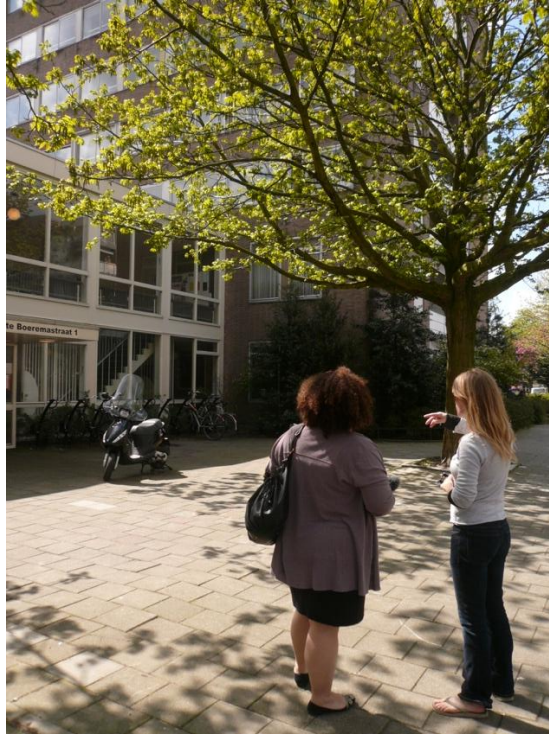
Figure 3- Réalisation d'un parcours multisensoriel au sein du quartier WGT à Amsterdam en 2010.

Quelle est votre perception du Ramau, et votre participation au réseau ?