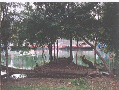
Taille des broussailles en bord de Seine, avant puis après l'intervention - Les Arplanteurs