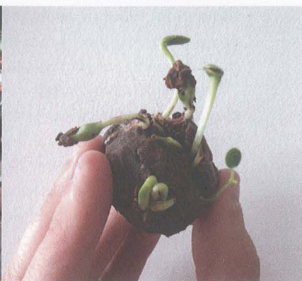
Bombes de graines - Atelier Coloco