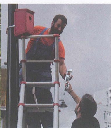
Cuicui, nichoirs dans l'espace urbain - Nicolas Deshais (Atelier NDF)