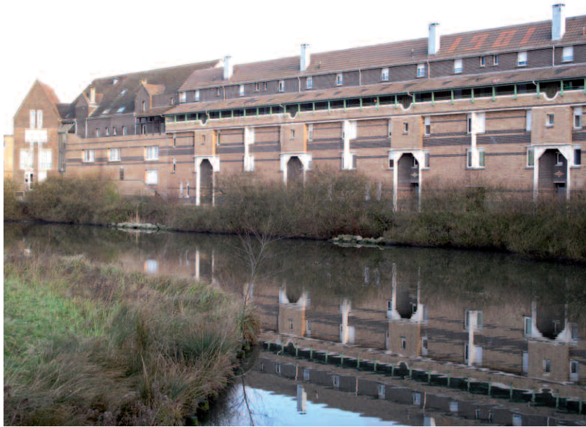
Collectif en rive du Watergang, avenue de Suwalki, square de Bruxelles, quartier du Moulin, Philippe Legros & GGK, 1981

ou l'immeuble- pont , hissé comme un héron sur le plan d'eau du Courghain et dont l'écriture s'affirme encore très moderne et très abstraite? Est-ce le projet de