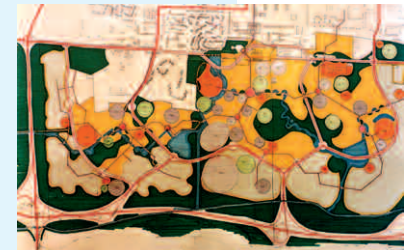
ZAC du Courghain, schéma du PAZ, extrait, novembre 1974