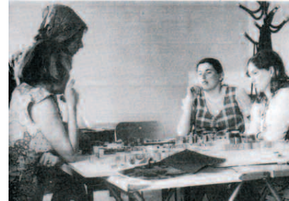
Plaquette de restitution de la concertation du centre-ville, page 22, le groupe CSCV. Octobre 1977.

Les individus organisés autour d'espaces verts et les équipements qui sont : crèche, annexe P.T.T., foyer des jeunes travailleurs, centre médical, commerces.