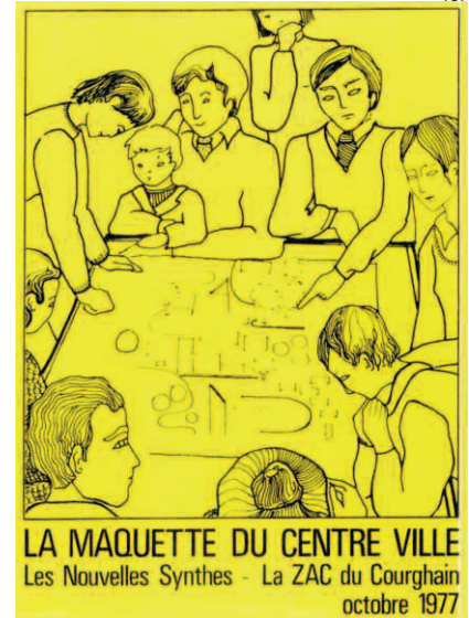
LA MAQUETTE DU CENTRE VILLE Les Nouvelles Synthèses - La ZAC du Courghain octobre 1977