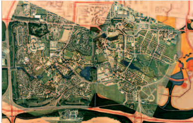
Schéma du PAZ sur orthophotoplan, Archives AGUR, cliché Eurosense, 2003.

L'équipe a dû faire face à des contradictions profondes, liées au processus même de fabrication du Courghain, à commencer par l'ordre de production. Au lieu de procéder par extension à partir d'un noyau, comme c'est le cas de toute "croissance urbaine ordinaire", elle a été contrainte de commencer par la périphérie (le logement individuel à l'ouest, par tranches de 50 unités).