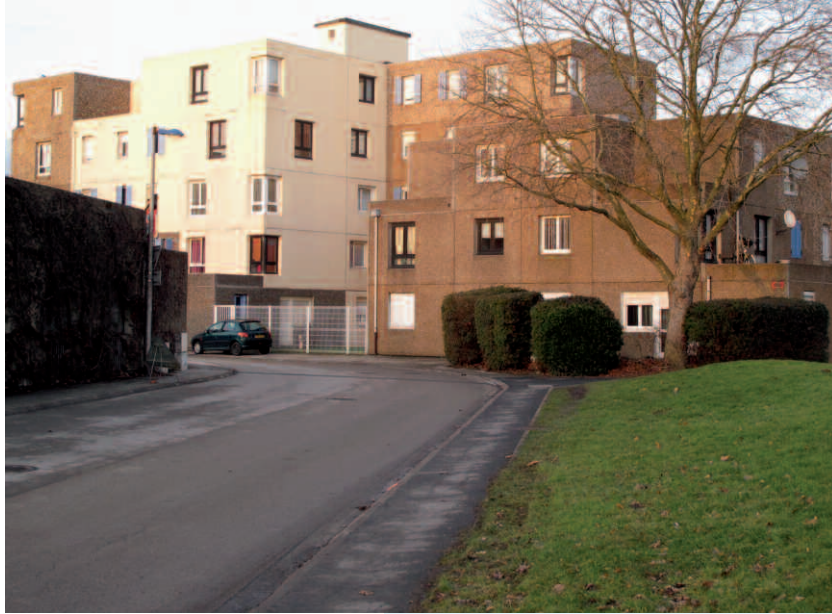
Collectif, rue Jacques Duclos, centre du Courghain, GGK, 1977 Photographie M. Prévot & C. Leclercq, 2009.