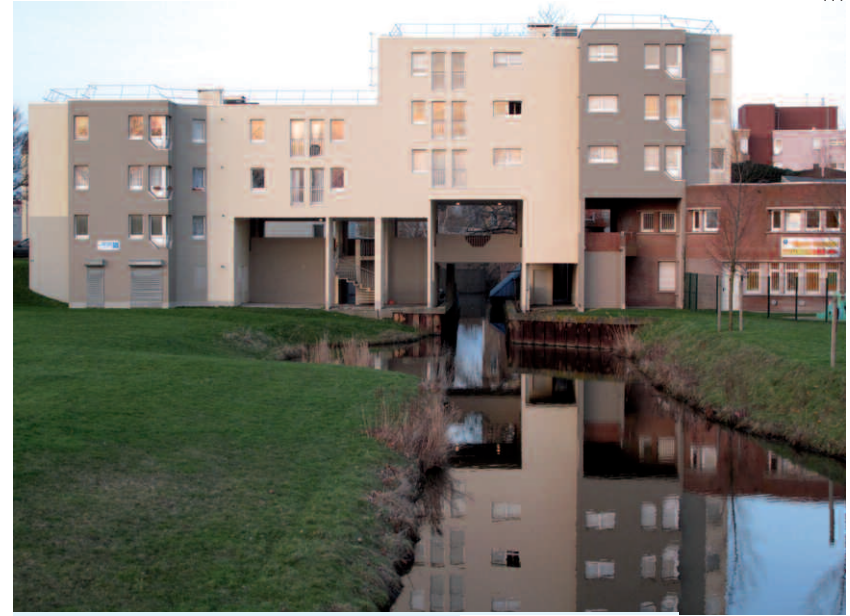
Collectif en surplomb du Watergang, rue Charles Tillon, quartier du Courghain, Philippe Legros & GGK, 1977 Photographie M. Prévot & C. Leclercq, 2009.

À mesure qu'on abandonne une structure urbaine moderne (et néo-vernaculaire) au profit d'une morphologie plus "haussmannienne", on s'éloigne du projet de la ville "discourante" pour revenir à une "ville discourue", une ville rhétorique qui ne ménage pas ses effets, et ce d'autant plus volontiers qu'elle se sent plus incertaine et plus menacée. Le Courghain, à l'insu de ses concepteurs, aura servi de laboratoire au postmodernisme. Par le doute doctrinal dont il était porteur (Voyé, 2003), un nouvel eclectisme surgit dans lequel le modernisme lui-même fait figure de référence. Au demeurant, la référence néo-régionaliste s'imposera rapidement comme le plus court chemin du consensus social et politique en matière d'image urbaine. La première réhabilitation de la ZUP de Grande-Synthe – des années 1980 – l'attestera. Mais plus largement, c'est toute l'agglomération, et bientôt tous les programmes, bien au-delà de la ZAC, qui adopteront majoritairement, ce même parti-pris esthétique.