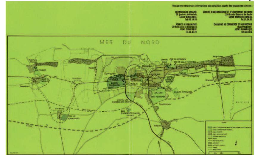
fig. 1 Le dunkerquois en projet, document de synthèse AGUR, 30 septembre 1973

privés 5 , et de diverses associations. La stratégie