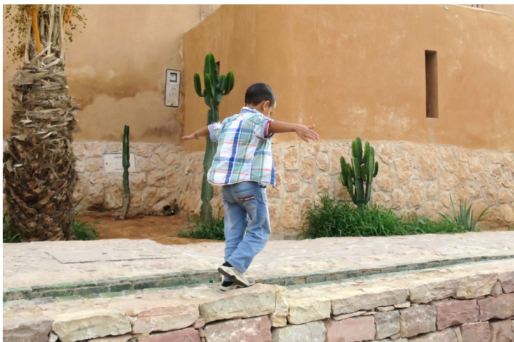
SURFACE D'APPUI [JOUER].

acrobaties et autres activités, si nombreuses, avec l'eau. La fonctionnalité des éléments d'architecture est débordée de toute part par l'investissement créatif de l'enfant. Le garde-corps circulaire qui entoure la source devient surface d'appui où l'on grimpe et depuis lequel prendre son élan pour sauter sous le regard des autres. Le lieu prend vie par l'intermédiaire de cette disponibilité affective et de cette spontanéité motrice de l'enfant, l'architecture en potentialise l'émergence. La présence de l'eau soulève une force d'attraction et donne un fondement corporel particulier à l'espace commun.