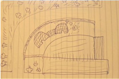
REPRÉSENTATIONS DU SITE PAR LE DESSIN D'UN ENFANT. ÉMERGENT LES ÉLÉMENTS DE SURFACE TACTILE: EAU, VÉGÉTATION, MURS DÉLIMITANT, KHETARRAS DONNANT UN «VOLUME LUDIQUE» À L'ESPACE.

amie l'accueille par quelques éclaboussures qui déclenchent des fous rires, les garçons sont alors prêts à se mêler au jeu. Derrière, assises contre le soubassement en pierre sèche du mur mitoyen, certains habitants du quartier profitent, avant la tombée du jour, d'une ombre providentielle et de l'attrait irrésistible que procure l'eau qui semble renaître d'elle-même. Les mères parlent entre elles et