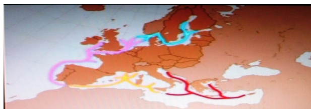
Fig.1 le réseau des autoroutes de la mer [Rapport de la commission européenne, 2005]