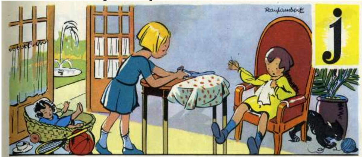
Figure 1 – Image de manuels de lecture de 1952

On voit ci-dessous l'exemple de deux manuels scolaires de lecture des années cinquante qui permettent d'identifier clairement ce programme caché d'éducation en acte.