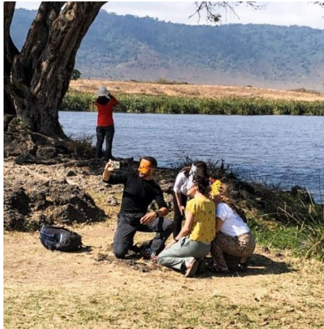
Figure 3 : Masques animaux. ©Christine Ambard, 2019.

animaux, un procédé pour créer, grâce à l'image, un espace de sympathie interspécifique en changeant son apparence pour tendre vers celle de l'autre ?