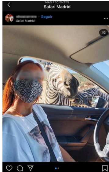
Figure 2 : Selfie zébré à Safari Madrid ., 2020.

l'objet froid et médical se transforme en motif d'expression identitaire, en un média pour véhiculer une idée, ou un sentiment.