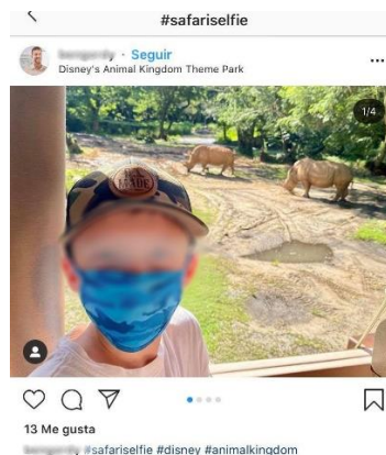
Figure 1 : Le garçon masqué et les rhinocéros à Animal Kingdom Disney , Orlando. (Capture d'écran sur Instagram, 2020, le visage a été flouté afin de garantir l'anonymisation).