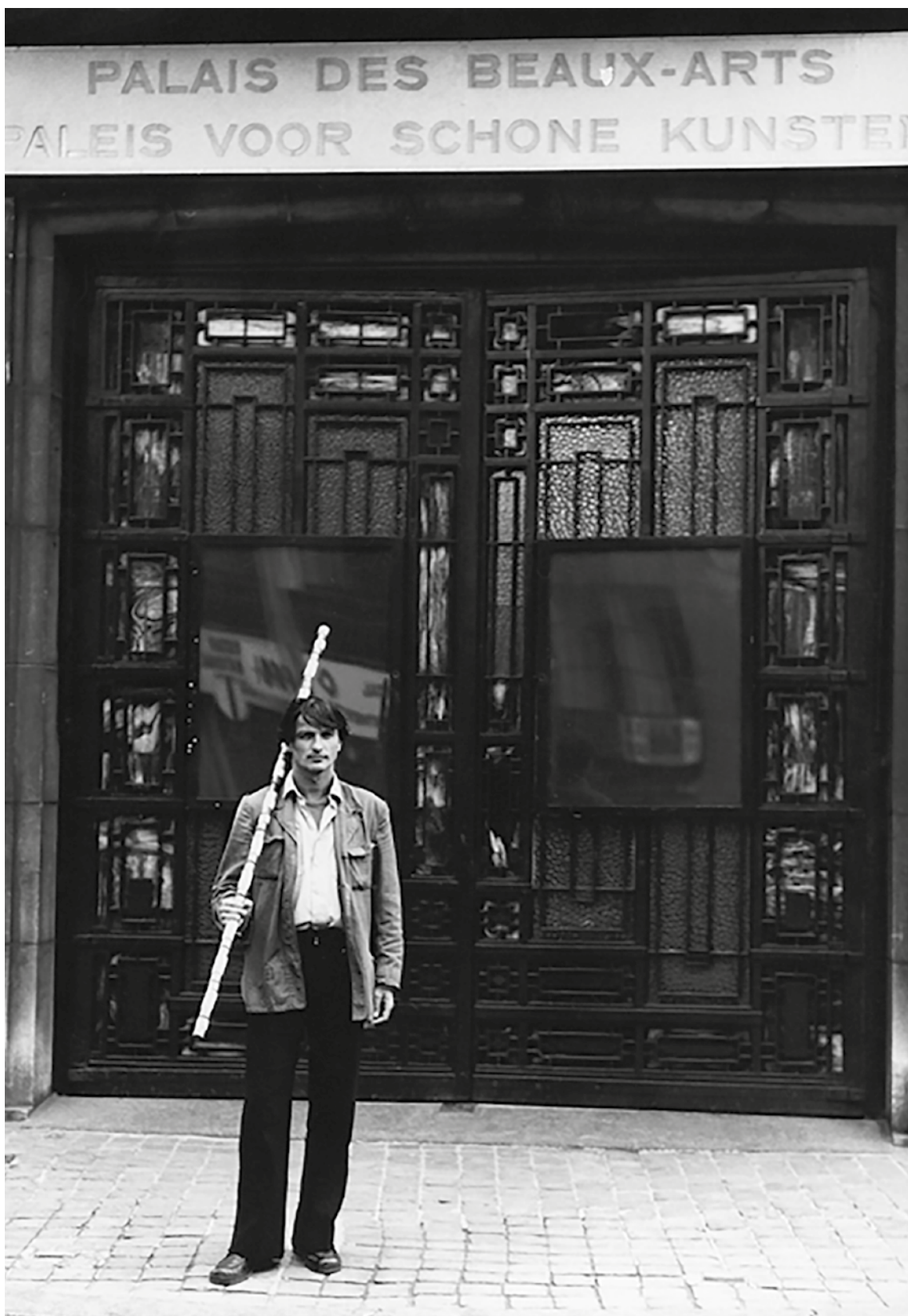
André Cadere przed Pałacem Sztuk Pięknych w Brukseli, 1974 / André Cadere in front of the Palace of Fine Arts in Brussels, 1974 / André Cadere, devant le Palais des Beaux-Arts, Bruxelles, 1974.