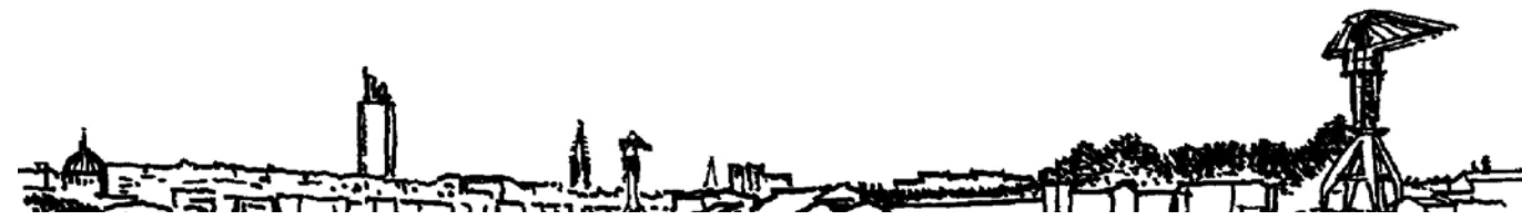
Croquis du port de Nantes, dessin d'Alexandre Chemetoff.

successives contradictoires les unes avec les autres et il n'y a pas, d'un côté, le passé qui serait une science certaine et l'avenir qui serait une science hypothétique.