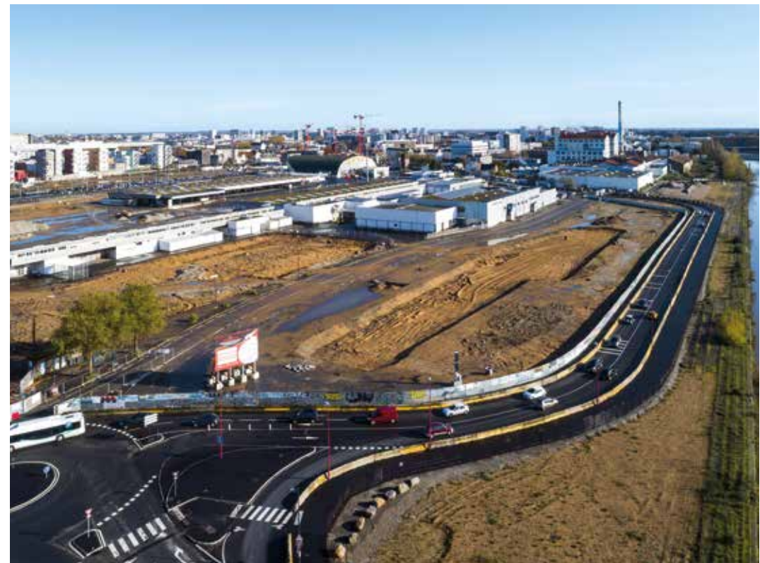
Chantier du Chu, ancien MIN de Nantes, novembre 2019.