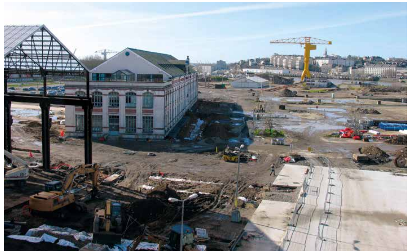
Les chantiers navals en travaux sur l'île de Nantes, 2007.

La Chambre de commerce avait déjà cherché à inscrire un projet sur l'île, la Zone internationale atlantique, qui consistait à imaginer un nouveau développement libéré de contraintes fiscales, sans relation avec l'histoire industrielle de la ville. Ce projet était combattu par Jean-Marc Ayrault au nom du respect d'une existence industrielle constitutive de Nantes. En 1997, avec l'accord de Jean-Marc Ayrault, j'ai lancé l'idée du projet Nantes 2005, qui portait notamment sur la question de l'estuaire et la solidarité entre Nantes et Saint-Nazaire. À son issue, il y avait évidemment le projet de l'île de Nantes. J'avais constitué une mission Île de Nantes, au sein du district tout d'abord, avec l'idée que l'on pourrait imaginer de gérer cette situation en interne dans l'agglomération et non pas de l'externaliser. En 1999, on lance l'idée du marché de définition, pour mettre plusieurs équipes de concepteurs en réflexion en même temps sur un projet urbain de grande échelle et dégager une maîtrise d'œuvre sur le long terme. Toute notre réflexion part de l'idée que ce n'est pas simplement un projet d'architecture : c'est un projet d'ensemble, économique, social, territorial et culturel. Il y a trop de dimensions pour que seules les conditions de la transformation d'une opération d'urbanisme viennent le signifier.