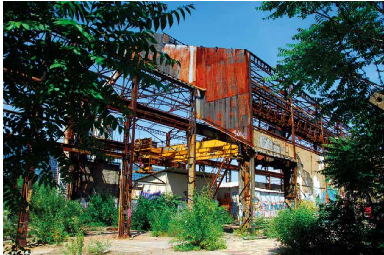
Friche des Fonderies, 2006.