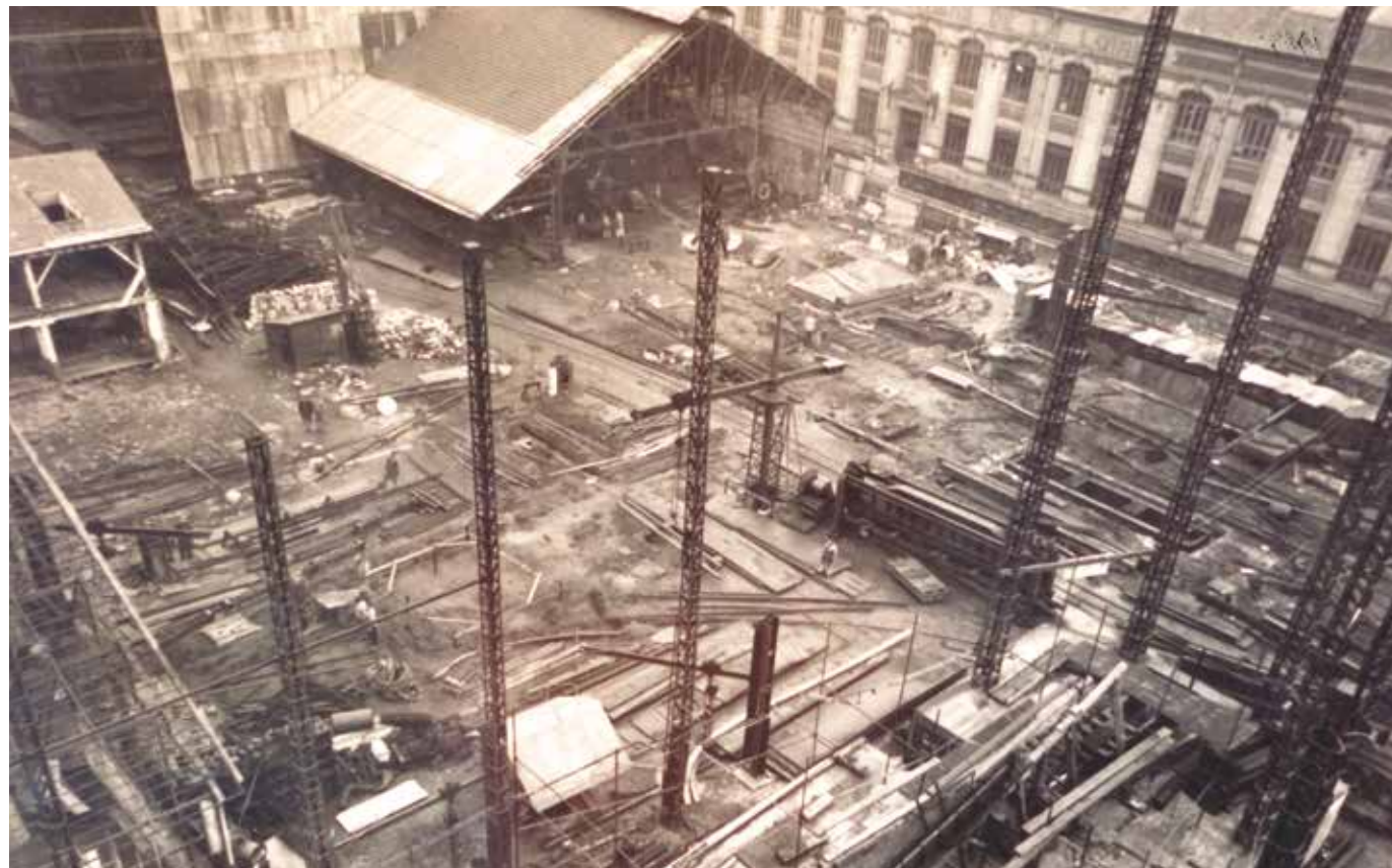
Démantèlement des chantiers navals de Nantes, site de la Prairie-au-Duc.