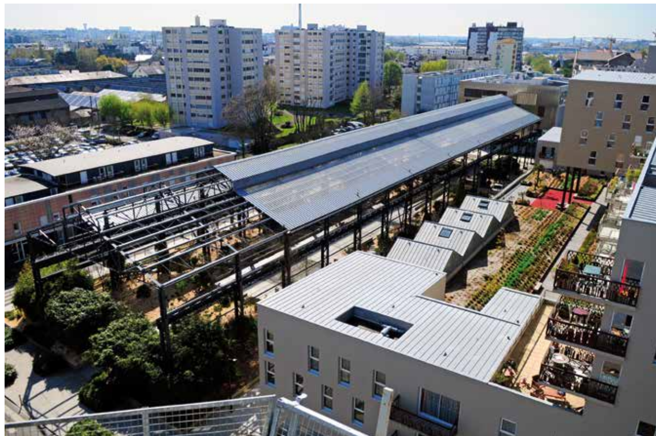
Les Jardins des Fonderies, avril 2012.