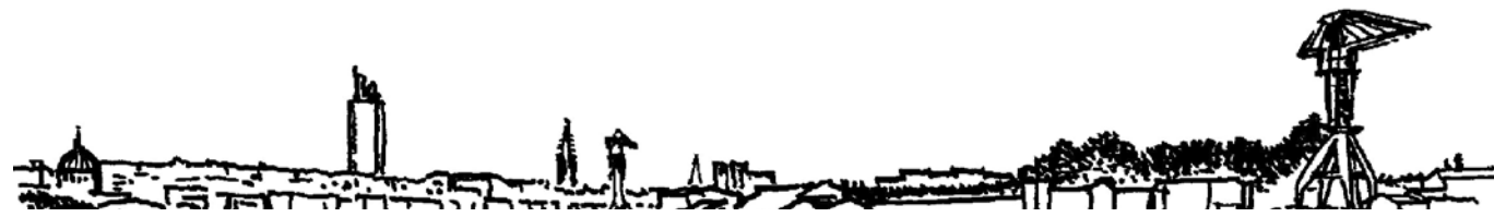
Croquis du port de Nantes, dessin d'Alexandre Chemetoff.

successives contradictoires les unes avec les autres et il n'y a pas, d'un côté, le passé qui serait une science certaine et l'avenir qui serait une science hypothétique.