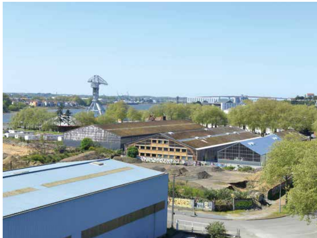
Les hangars Solilab et Karting, avril 2014.

Bernard Brémond, nous a permis d'opérer cette transformation essentielle: à partir du bâtiment des bureaux d'Alstom, on pouvait imaginer une transformation de l'activité industrielle sous forme d'activités tertiaires.