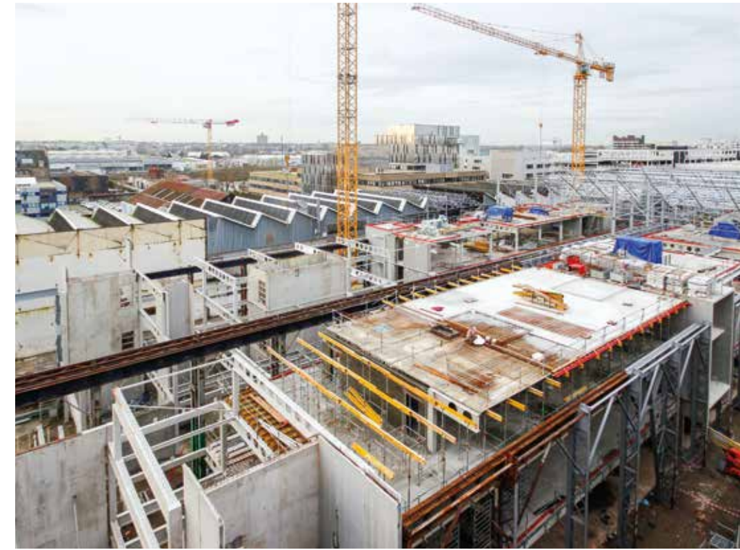
Réhabilitation des halles Alstom, halle 5, chantier de l'ESBANM (école des beaux-arts), janvier 2016.

un peu la Loire qui est devenue métropolitaine plutôt que le parc.