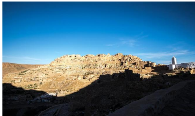
Figure 1: Image panoramique du village de Chenini.

Le village de Chenini est caractérisé par les traces de la berbéricité qui y sont conservées. Ce sont ses particularités qui nous ont incitées à explorer cette bourgade.