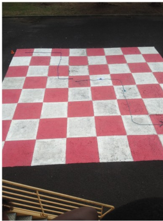
Figure 3: Lorsqu'ils se tiennent en haut d'un escalier, les élèves disposent d'une vue panoramique sur l'ensemble d'un damier géant

Selon cette approche, il semble donc logique de penser que les enfants qui ont été exposés à la bi-modalité RT (Robot + Tablette) présentent des performances plus élevées dans les scores de post-tests que les élèves qui ont été exposés à la mono-modalité B. Les analyses statistiques ont confirmé cet aspect (cf. Figure 2). Cependant, cela devrait également être le cas pour les mono-modalités R et T prises séparément. Et pourtant, ce n'est pas ce que nous observons avec la Figure 2. Examinons de plus près la modalité T pour mieux comprendre ce phénomène.