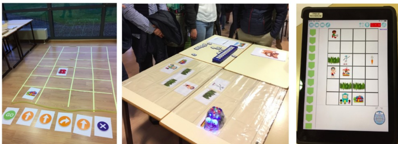
Figure 1: De gauche à droite, les trois modalités utilisées pour la séance ludopédagogique de Blue Bot : Corps, Robot et Tablette