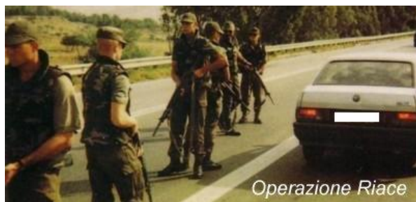
Pattuglia dell'EI durante l'Operazione Riace Immagine 7

Questa operazione prende forma in Calabria dal 2 febbraio 1994 al 15 dicembre 1995. 1.350 uomini al giorno, inquadrati in due reggimenti a loro volta articolati in cinque settori di gruppo tattico (unità a livello di battaglione rinforzato) per lo sviluppo delle attività di controllo 46 . Era un intervento mirato