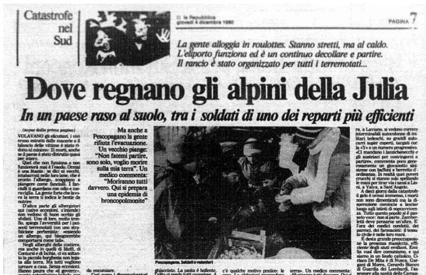
Immagine 4

disastrosi. Il percorso si concluse nel '92 con la nascita della Protezione Civile Italiana che diede finalmente una forma alla terza richiesta che il generale Rambaldi fece tempo prima al Ministero della Difesa.