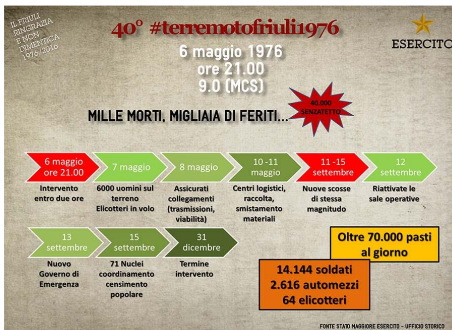
Immagine 2