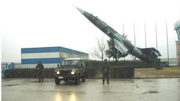
Lagunari in pattuglia durante l'operazione Domino Immagine 8

Domino ha avuto inizio a seguito degli attacchi dell'11 settembre 2001 alle torri gemelle, in conseguenza dei quali il Consiglio dei Ministri ha approvato con decreto, il 12 ottobre 2001, l'impiego di personale della Forza Armata in concorso alle forze di Pubblica Sicurezza per la vigilanza di punti sensibili su tutto il territorio nazionale, come, ad esempio, le aree esterne a basi, installazioni e caserme NATO e/o U.S.A., i centri di trasmissioni e comunicazioni, gli impianti di erogazione di servizi di pubblica utilità, le aree esterne ed eventualmente interne, di porti, aeroporti ed impianti ferroviari 58 .