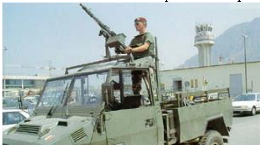
Paracadutisti all'aeroporto di Punta Raisi durante l'operazione Vespri Siciliani Immagine 6- Fonte: Esercito Italiano

Come per l'operazione Forza Paris, anche l'operazione Vespri Siciliani ha avuto il suo evento scatenante: la strage di Capaci del maggio 1992. Il nome dell'operazione è stata ispirata questa volta dall'omonima rivolta del XIII secolo mossa dal popolo siciliano contro i dominatori francesi della Casa d'Angiò. Entrata nella sua fase operativa dopo sei giorni dall'attentato omicida contro il giudice Paolo Borsellino e la sua scorta (strage di via d'Amelio), quest'intervento ha coinvolto 37 reparti dell'Esercito Italiano distribuiti su tutto il territorio regionale 40 in un arco di tempo di sei anni. Il capo della Polizia, Vincenzo Parisi, concordò con il generale Goffredo Canino, allora Capo di Stato Maggiore dell'Esercito, di dare ai militari impiegati le funzioni di agenti di pubblica sicurezza. Il coordinamento fu affidato ai Comitati provinciali per l'ordine e la sicurezza guidati dai prefetti, e con la partecipazione di un ufficiale dell'Esercito 41 . Il 14 agosto operavano in Sicilia oltre 8 mila militari: 1.000 paracadutisti della Brigata Folgore e 500 lancieri del VI Gruppo Squadroni Lancieri di Aosta a Palermo; 1.800 alpini della Brigata Julia a Enna, Ragusa e Siracusa; 1.500 soldati della Brigata Aosta a Catania e Messina; 800 bersaglieri del XXVIII Battaglione