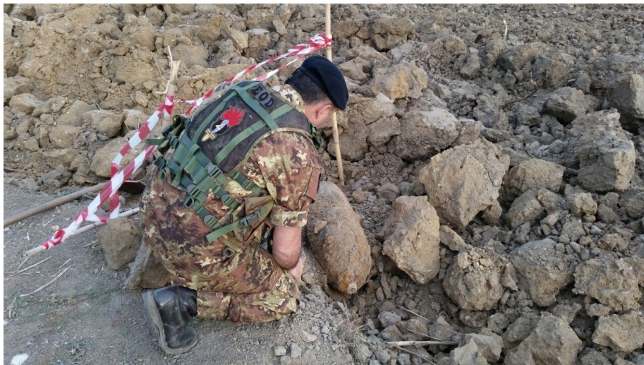
Artificiere del IV Rmt Guastatori in azione Immagine 5

Si potrebbe pensare alla costante flessione del numero di questi interventi, invece da quando essi vengono effettuati non vi è stata alcuna flessione delle richieste pervenute ai Fod. Pertanto, è possibile sostenere con certezza che questo genere di attività ha rappresentato e rappresenterà ancora per degli anni, l'ossatura attorno cui si è costituita e continua a praticarsi la cooperazione civile-militare e la protezione civile. Infatti, il costante contatto tra prefetture, commissariati, rappresentanti politici e Esercito rappresenta una pratica di riferimento sia per altri settori della cooperazione civile-militare che per gli altri Paesi stranieri per quanto riguarda il ruolo duale dell'esercito: in diversi scenari all'estero l'EI non solo è intervenuto per operazioni di bonifica del genere ma ha anche addestrato militari e civili all'organizzazione “cooperativa” in questo settore. Pertanto, questo è un importante punto di riferimento per il mantenimento dell'incolumità dei cittadini e per la reputazione e il prestigio dei due Comandi Forze di Difesa e dell'Esercito nel suo complesso.