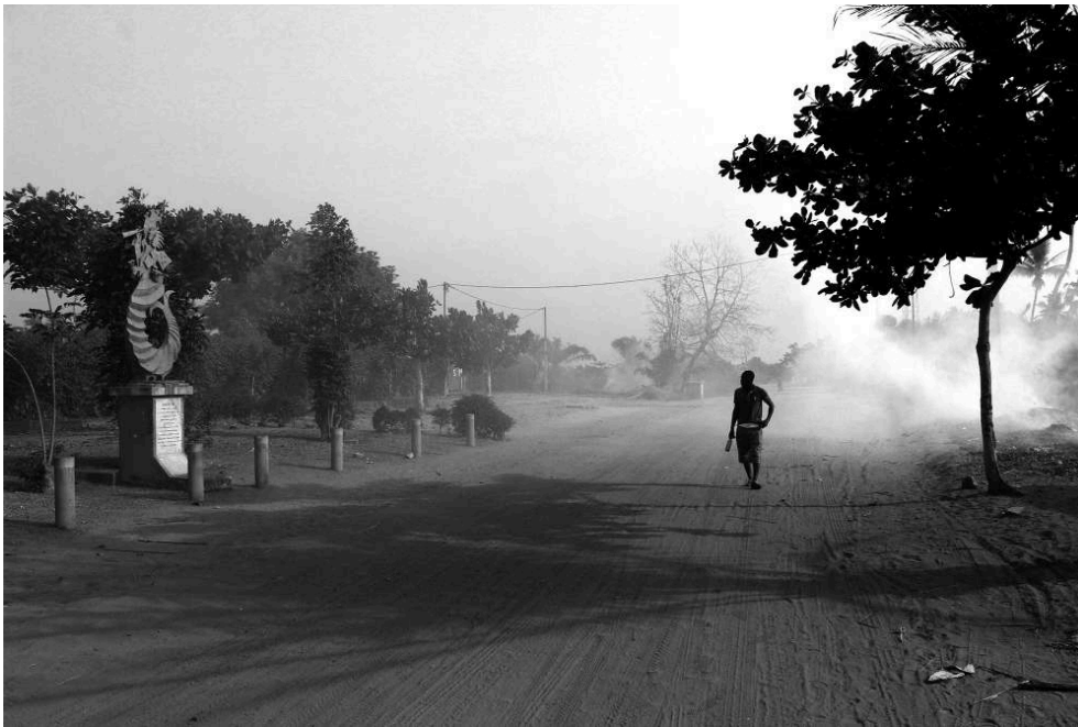
Figure 7. La Route de l'Esclave (Ouidah, 2017).

La photographie illustre le rapport d'échelle entre l'individu et la sculpture.