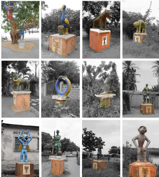
Figure 4. Inventaire de quelques sculptures de la Route de l'Esclave (Ouidah, 2016).

Sur chacune des photographies, seul l'artéfact mémoriel (sculpture ou arbre) est laissé en couleur. Ce traitement graphique est volontaire, et a pour but de mettre en exergue le trait des sculptures et de neutraliser l'environnement paysager très végétalisé qui entoure les œuvres.