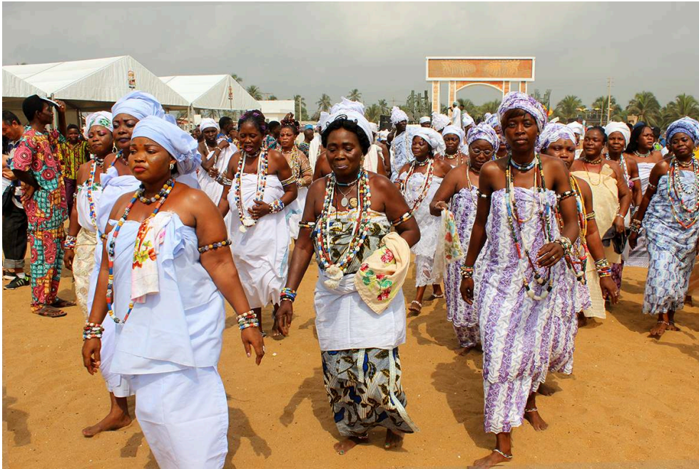
Figure 9. La fête du vodun sur la plage de Ouidah (2018).

La cérémonie est réalisée par les adeptes de Mami Wata, identifiables notamment grâce à leurs tenues de cérémonie blanches. Ce rituel, mis en scène à l'occasion de cette journée, témoigne de l'importance de l'acte de la prière.