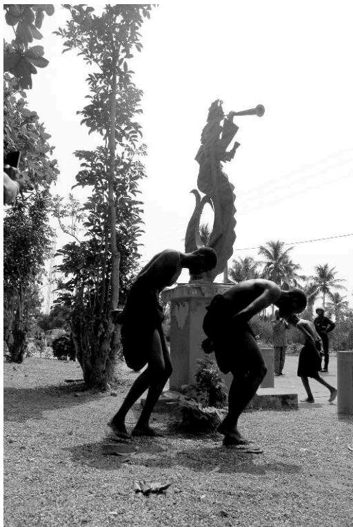
Figure 8. La seconde étape de la Route de l'Esclave : la sculpture de Mamie Wata, l'Arbre de l'oubli (Ouidah, 2016).

Parvenus à cette étape, les cinq « esclaves » tournent neuf fois autour de la sculpture. Comme expliqué sur le socle de l'œuvre, « ces tours étant accomplis, les esclaves étaient censés devenir amnésiques. Ils oubliaient complètement leur passé, leurs origines, leur identité culturelle pour devenir des êtres sans aucune volonté de réagir ou désobéir. »