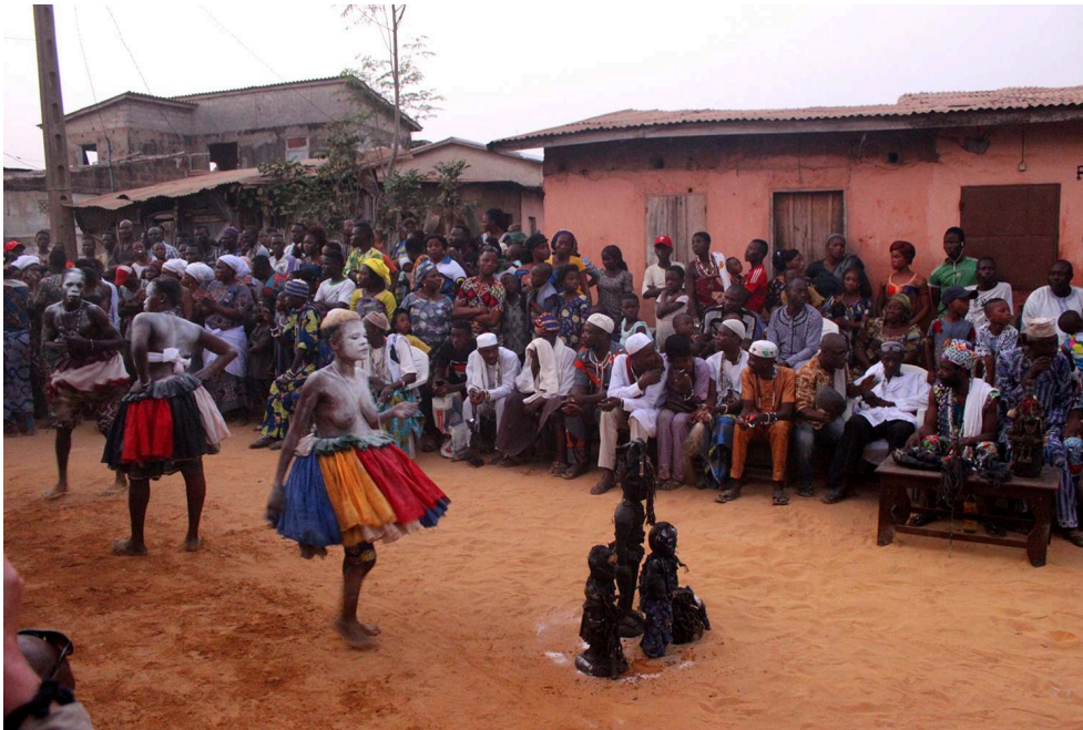
Figure 10. Cérémonie réalisée dans une des rues de Ouidah, en fin de journée, par les adeptes de la divinité Gambada (2018).

Vêtus d'un costume et le corps recouvert d'une poudre blanche, les adeptes dansent et chantent à proximité d'un autel installé, pour le rituel, au milieu de la rue.