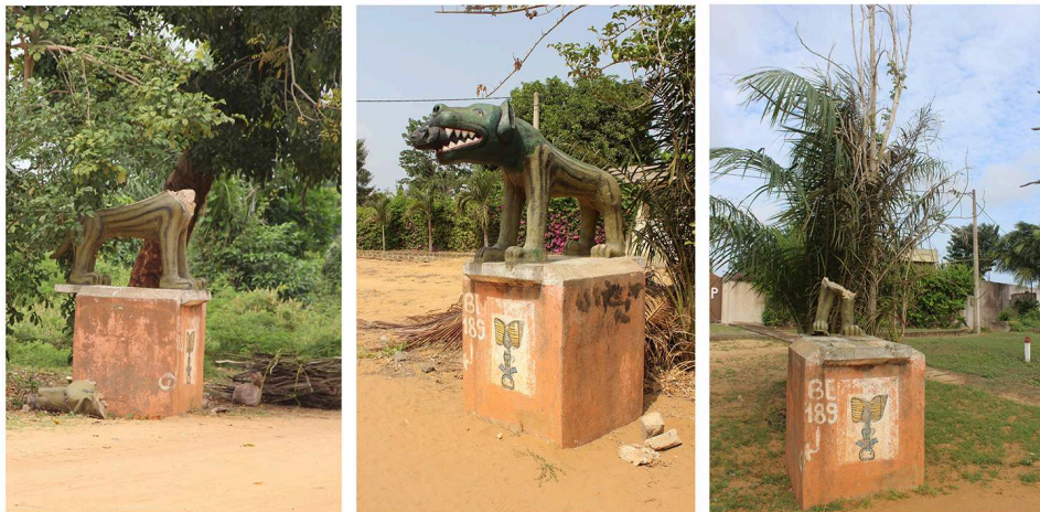
Figure 5. La sculpture de panthère à Ouidah (2015, 2017 et 2019).

Les photographies successives illustrent les processus de dégradation, reconstruction et détérioration de la sculpture.