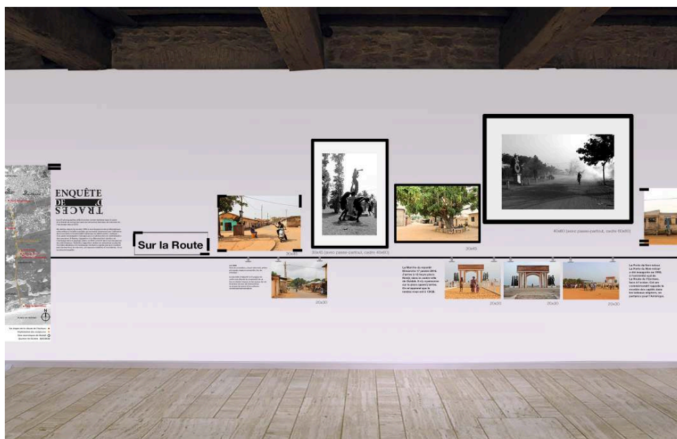
Figure 11. Proposition d'aménagement scénographique pour l'exposition des photographies prises durant ma recherche doctorale (Centre culturel de recherche international, Ouidah, 2020).

L'organisation spatiale et l'accrochage proposés visent à valoriser les photographies, qui sont à la fois les supports de l'étude mais aussi les produits de cette recherche.