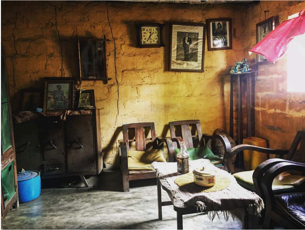
Figure 3. Le salon d'une enquêtée (Ouidah, 2018).

Sur la table basse en bois, recouverte d'une nappe, se trouvent une casserole et une bouteille de whisky. Plusieurs de mes entretiens commencent ou s'achèvent par le partage d'un verre d'alcool, souvent du sodabi , l'alcool local à base de vin de palme.