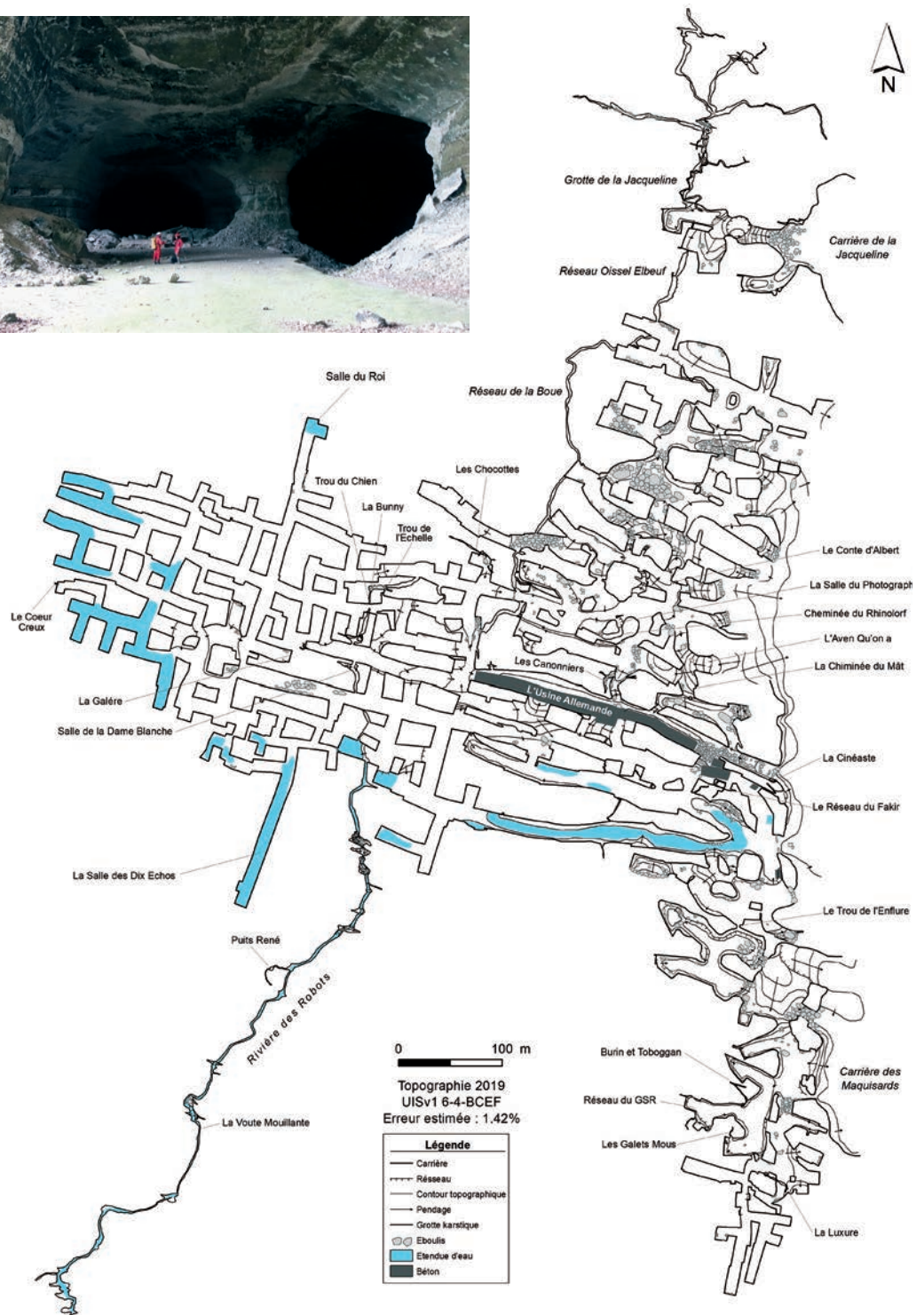
Figure 1 : carte des carrières et grottes de Caumont réactualisée grâce à un nouveau relevé spéléologique complet effectué en 2019.