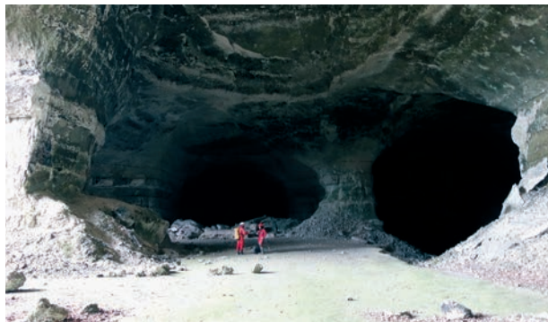
La salle d'entrée de la carrière des Maquisards.

Au milieu du XX e siècle, les Grandes Carrières de Caumont connurent d'autres usages. Par exemple, les vestiges d'une usine allemande, construite entre 1943 et 1944 pendant la Seconde Guerre mondiale,