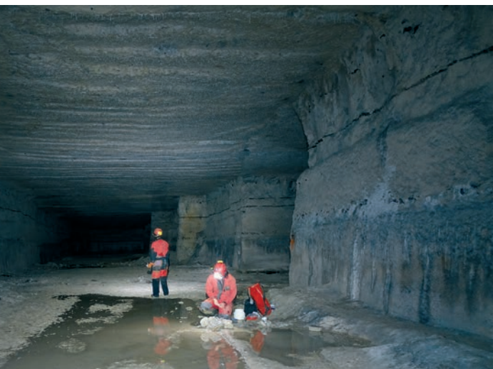
Collecte périodique de gouttes d'eau pour étude chimique, près de la salle des Rois.

longent actuellement une galerie, face à l'entrée de La Cinéaste (figure 1). Il s'agit d'un ouvrage en béton de type bunker s'étendant sur 300 m de long. Ce bâtiment était destiné à la fabrication d'oxygène liquide, gaz initialement prévu comme carburant pour les missiles V2 de guerre. La construction de cette usine n'a pas été achevée et les objectifs liés à sa construction n'ont jamais été atteints. Les carrières ont également été utilisées comme entrepôt de munitions et autres matériaux; des toits de tôles goudronnées ont préservé une partie des structures des eaux de percolation. Après la Seconde Guerre mondiale, une champignonnière dans les Grandes Carrières fut implantée en 1962 dans les Grandes carrières, au sud de l'usine allemande. Son activité ne dura que quelques années. Actuellement, cet espace souterrain sert à des activités d'exploration et d'initiation à la spéléologie.