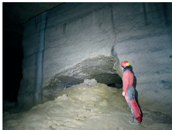
Une des galeries du réseau karstique trépanées par la carrière.

La topographie spéléologique de l'ensemble du réseau accompagne les travaux de désobstruction et d'exploration des siphons dès 1971 grâce aux efforts du Groupe spéléologique normand universitaire (GSNU). Les relevés spéléologiques de l'ensemble des réseaux