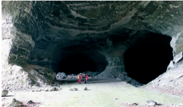
La salle d'entrée de la carrière des Maquisards.

Au milieu du XX e siècle, les Grandes Carrières de Caumont connurent d'autres usages. Par exemple, les vestiges d'une usine allemande, construite entre 1943 et 1944 pendant la Seconde Guerre mondiale,