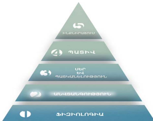
Գծանկար 1. Մասլոուի պահանջմունքների բուրգը

Վտանգության նկատմամբ պահանջմունքը արտացոլված է տնտեսագետներին քաջ հայտնի ամերիկացի հայտնի հոգեբան, հումանիտար հոգեբանության հիմնադիր Ա. Մասլոուի (Abraham Maslow) պահանջմունքների բուրգում (տե՛ս Գծանկար 1) և համարվում է մարդու հիմնարար պահանջմունքներից մեկը՝ տեղ գտնելով ֆիզիոլոգիական պահանջմունքներից անմիջապես հետո: