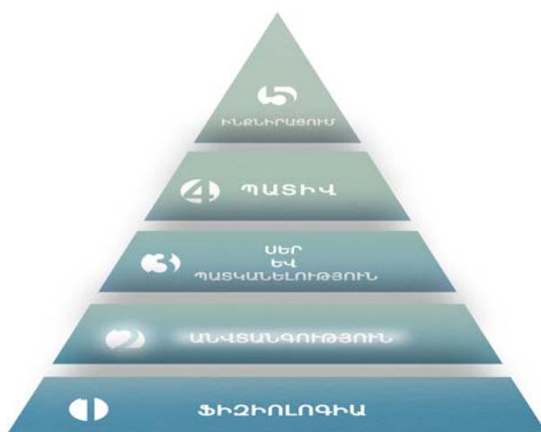
Գծանկար 1. Մասլոուի պահանջմունքների բուրգը

Վտանգության նկատմամբ պահանջմունքը արտացոլված է տնտեսագետներին քաջ հայտնի ամերիկացի հայտնի հոգեբան, հումանիտար հոգեբանության հիմնադիր Ա. Մասլոուի (Abraham Maslow) պահանջմունքների բուրգում (տե՛ս Գծանկար 1) և համարվում է մարդու հիմնարար պահանջմունքներից մեկը՝ տեղ գտնելով ֆիզիոլոգիական պահանջմունքներից անմիջապես հետո: