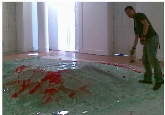
Figure 4. Extrait de l'exposition Design maço (2012) conçue par Paolo Deganello.

Exemple de conception sans utilisation et consommation de nouvelles ressources. Les photos montrent de quelle façon le verre (déchet d'autres installations) est brisé directement sur place pour servir de base aux chaises exposées. À la fin de l'exposition, tous les matériaux sont retournés aux entreprises qui recyclent les matériaux utilisés.