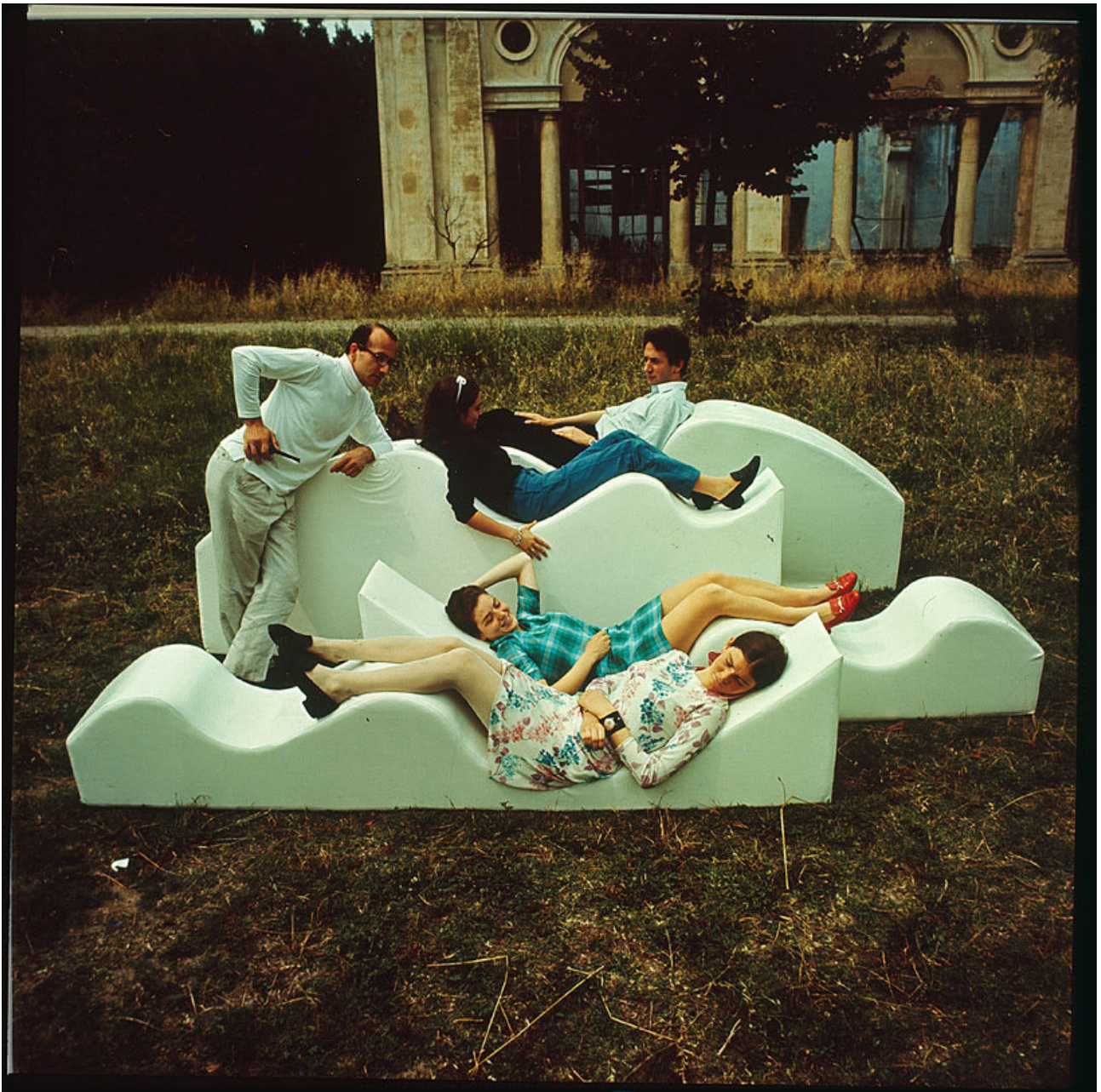
Figure 3. Superonda , Archizoom, 1966.

Aujourd'hui la massification de l'esthétique est un processus achevé, l'écologie quant à elle a une nouvelle tâche fondamentale contribuant à l'élaboration d'un nouveau projet critique consistant en la conversion écologique des biens. C'est cela le projet critique nécessaire aujourd'hui : démontrer la beauté et la supériorité des biens écologiques, en gardant bien à l'esprit que l'écologie ne doit pas faire partie de la restauration du luxe et du privilège, mais d'une diffusion structurale de la conception écologique et esthétique à l'échelle de tous les biens. De cette façon, le design peut répondre aux nouveaux rebelles qui crient : « rendez-nous l'avenir que vous nous avez volé ».