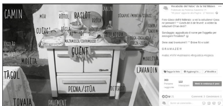
Figura 4 Esempio di pubblicazione sulla pagina del VVV con la soluzione del gioco pubblicata ogni venerdì.