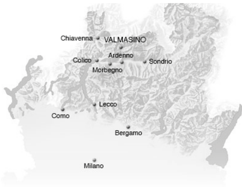
Figura 1 Cartina della provincia di Sondrio (Nord della Lombardia), localizzazione della Val Masino

Seppur isolata, tutta questa regione alpina è stata caratterizzata da migrazioni a partire dalla fine del XIX secolo fino ai giorni nostri. 17 Il valoc' è stato così esportato nel mondo con il processo migratorio ed ha toccato in primo luogo gli Stati Uniti, l'Australia e l'Argentina e si è poi avvicinato, a partire dagli anni Sessanta, ai grandi centri urbani italiani quali Milano, Roma, Lecco e la vicina Svizzera, in particolare i cantoni del Ticino, di Basilea e di Zurigo e la Francia.