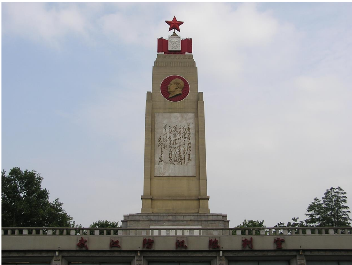
Anonyme, Stèle commémorative de la digue contre les inondations de Wuhan , érigée en 1969, district de Jiang'an.