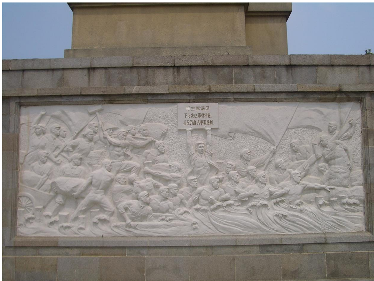
Anonyme, Stèle commémorative de la digue contre les inondations de Wuban , district de Jiang'an, détail sur le poème de Mao Zedong Nager (1956).