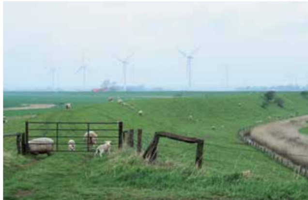
Vers Hattstedtermarsch, avril 2015.

pour maintenir l'activité agricole et d'autres héritages auxquels chacun était attaché, tout en imaginant les possibilités nouvelles de vivre avec les éoliennes selon différentes modalités. Il s'agissait de trouver des ajustements entre les intérêts en présence et les conditions du vent, à l'intérieur de l'assemblée réunie et à l'extérieur, pour rechercher et partager des informations, rechercher et choisir des technologies, rechercher et obtenir les autorisations pour placer les éoliennes, pour rechercher des financements auprès