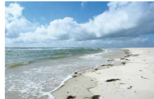
Plage ouest de l'île d'Amrum, mer du Nord, juillet 2017.

Ce raisonnement montre aussi que la question de la transition n'est pas seulement d'opérer un changement de ressources mais de comprendre comment nous nous transformons nous-mêmes, et en relation aux autres, humains et non-humains, dans les expériences de transition. Plutôt qu'une pensée du futur et d'une anticipation des changements climatiques, il s'agit d'une proposition de relecture écologico-pragmatiste de la relation paysage-climat en termes de responsabilité, c'est-à-dire en termes de réponses que nous pouvons apporter à ce, celles et ceux avec lesquels nous sommes en relation 25 . Elle invite à réfléchir au soin porté au présent, en rendant palpable ce sur quoi nous pouvons intervenir, ici et maintenant. Il s'agit de remettre au centre les capacités d'agir collectivement avec le paysage, en pensant ses héritages et les conséquences de ses transformations. C'est une proposition pour repolitiser les temps d'incertitude, en revenant aux fondamentaux des sources de la vie que sont le soleil, le vent et la pluie, et aux besoins que les êtres humains ont d'en faire des ressources pour leur survie.