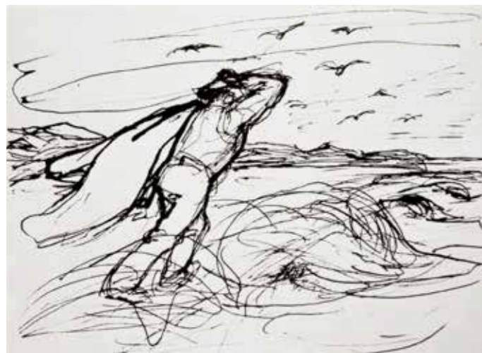
Emil Nolde, Federzeichnungen , 1901.

Le vent peut être considéré comme un acteur majeur de la fabrique des paysages, non seulement pour son action propre mais aussi pour celles qu'il fait faire aux êtres humains. L'imposante matérialité des nouveaux paysages de l'énergie éolienne divise, notamment parce qu'elle renvoie à la question des qualités relationnelles entre êtres humains et ressources. Pour en débattre, il est intéressant de comprendre finement et dans le contexte les processus de fabrique de ces paysages : comment les humains s'organisent-ils autour du vent, vivent-ils une expérience avec lui et se réorganisent-ils pour en inventer une suite, si possible commune, en continuité et en équilibre ?