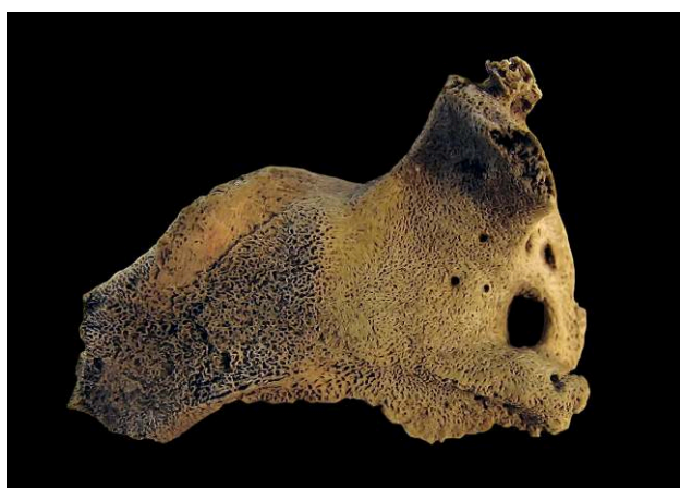
Figure 4. Grande aile du sphénoïde droit, individu 132, périnatal / Right greater wing of sphenoid bone, skeleton 132, perinatal