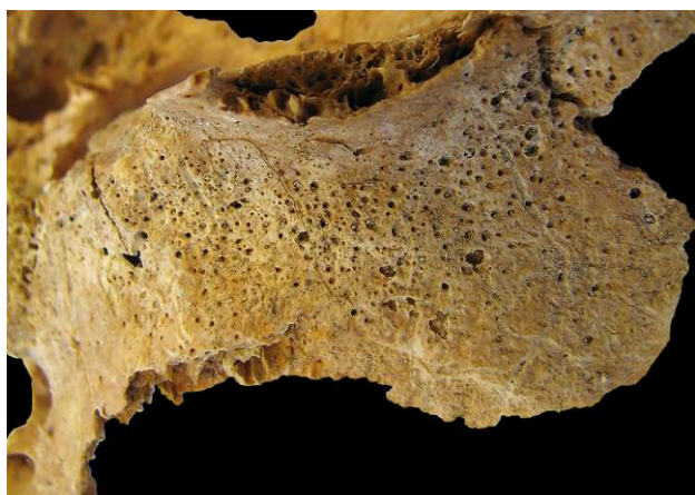
Figure 3. Grande aile du sphénoïde gauche, individu 38 (âgé entre 5 et 9 ans) / Left greater wing of the sphenoid bone, skeleton 38 (5-9 year-old child)