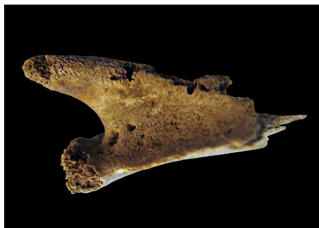
Figure 5. Scapula droite, individu 172, périnatal / Right scapula, skeleton 172, perinatal