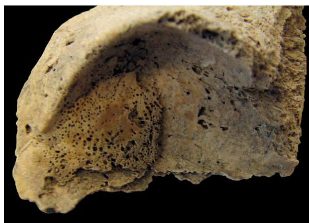
Figure 6. Orbite droit, individu 279, âgé entre 1 à 4 ans / Right orbital roof, skeleton 279, 1-4 year-old child