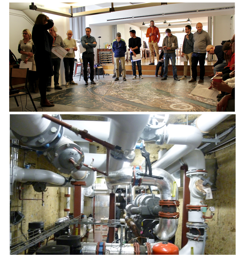
Séminaire int. / Itinéraire

3 thématiques de recherche comme autant d'enjeux pour penser à l'échelle du bâtiment et du quartier: