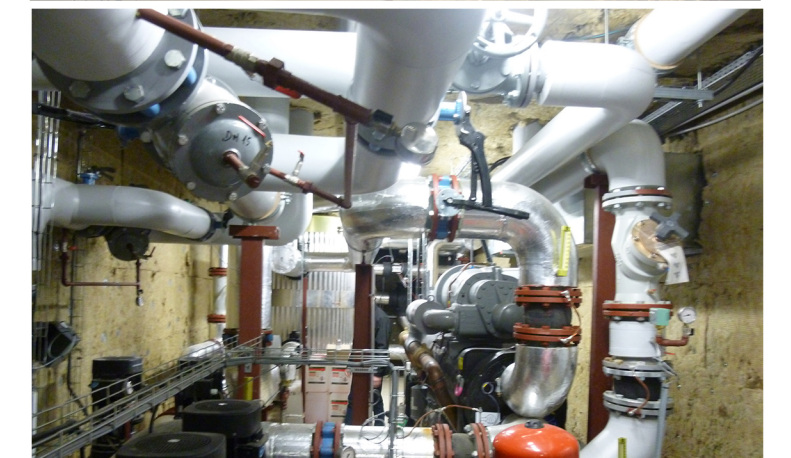
Séminaire int. / Itinéraire

3 thématiques de recherche comme autant d'enjeux pour penser à l'échelle du bâtiment et du quartier: