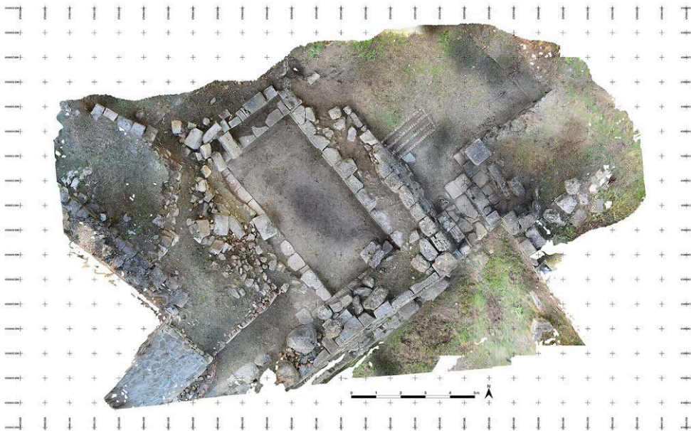
Fig. 4. Orthoimage planaire de la poterne du rempart est.