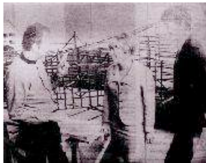
[Fig. 3] Constant Nieuwenhuys avec la journaliste Betty van Garrel et Rem Koolhaas (photo parue en 1966 sur Haagse Post ).

La réalisation du « film combo » 1, 2, 3 Rhapsody par le groupe « 1, 2, 3, einz » a lieu dans un carrousel où chacun des participants siège et occupe différents rôles : scénariste, réalisateur, acteur. Cet espace de création collective peut donc être lu comme un laboratoire de la création filmique , une option alternative aux politiques de paternité de l'œuvre soutenues par la Society of the Spectacle ou par la Nouvelle Vague française. Comme le démontre l'intérêt du jeune Koolhaas envers les idées « utopiques révolutionnaires » de l'architecte Constant Nieuwenhuys, plus connu comme Constant, le modèle de film factory du groupe « 1, 2, 3, einz » a sans doute été puissamment influencé par les idées de l'Internationale Situationniste.