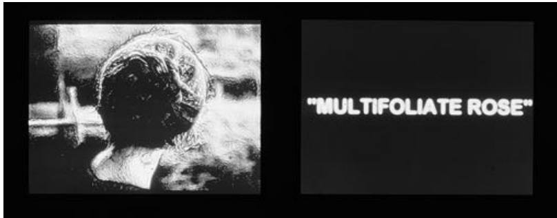
Fig. 2: C. Marker, di OWLS AT NOON Prelude: The Hollow Men , 2005

leil (1983) a Le Tombeau d'Alexandre (1992).