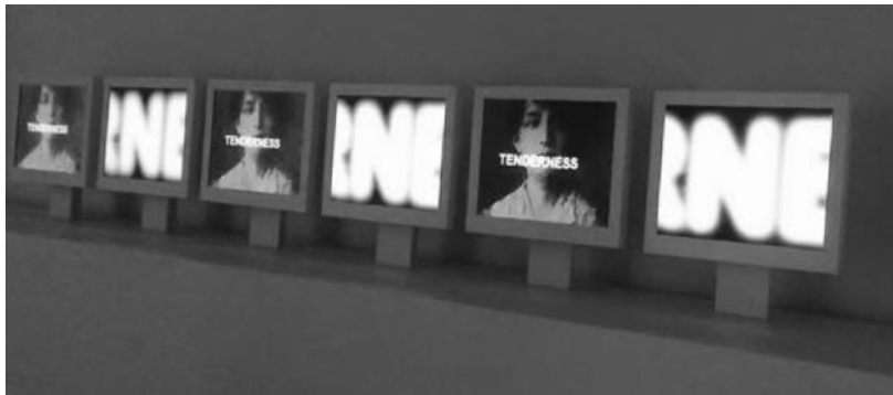
Fig. 1: C. Marker, OWLS AT NOON PRELUDE: The Hollow Men , 2005, installazione concepita per la Yoshiko and Akio Morita Gallery ed esposta per la prima volta al MoMA di New York dal 27 aprile al 13 giugno 2005