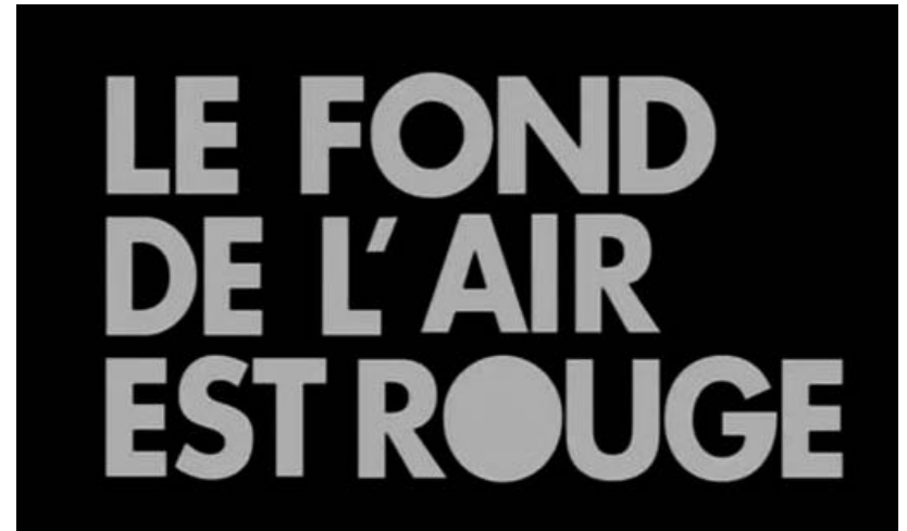
Fig. 6: C. Marker, Le Fond de l'air est rouge. Scènes de la Troisième Guerre mondiale (1967-1977)

Il montaggio polifonico che Marker descrive nella prefazione al testo e alla descrizione di Le Fond de l'air est rouge è un «montaggio orizzontale»: l'immagine non rinvia a un'altra che la precede o la segue, ma a un'immagine laterale che non si giustappone sequenzialmente a essa, ma interferisce con il suo corso complicandone la temporalità e la relazione spaziale con le altre immagini. È André Bazin che introduce l'idea di «montaggio orizzontale» nel suo commento a Lettre de Sibérie (1958) di Marker 32 . Un'orizzontalità in cui echeggia bizzarramente l'idea ejzenštejniana di «montaggio verticale», ovvero di contrappunto audiovisivo tra le diverse componenti dell'immagine.