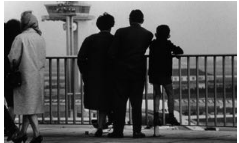
Fig. 4: C. Marker, La Jetée , 1962

18 — T. S. Eliot, The Poems of T. S. Eliot , cit., 179.