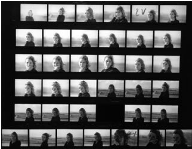
Fig. 3: Hélène Châtelain in La Jetée , 1962.